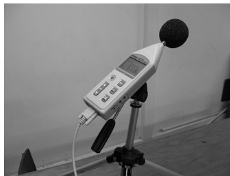
Figura No. 1 Sonómetro

Para calcular el valor de la atenuación de ruido de los materiales se requiere medir los niveles de potencia sonora NPS antes y después de colocada la muestra, como ya se mencionó anteriormente. Para la obtención de estos valores se hace necesario el desarrollo de una metodología de análisis y medición acústica la cual conlleva al diseño y construcción respectiva de un “ Sistema de medición del índice de atenuación de sonido ” que para facilidad se lo nombra con las siglas SM. Este sistema funciona de acuerdo a las bases teóricas de la acústica, en donde se tiene en cuenta el comportamiento del sonido en espacios cerrados y como medio de propagación al aire. Los Elementos que conforman el SM son, Generador de ondas, Amplificador de señal, Alto parlante, Sonómetro y software. Se describe al sonómetro como un instrumento de medida que capta los cambios en la presión sonora. La unidad de medida es el decibel (A). El sonómetro usado fue un Extech 407764 [9], (ver figura 1) y está conformado por: un micrófono , que convierte la variación de presión sonora en variación equivalente de señal eléctrica; el preamplificador , que transforma la alta impedancia del micrófono en baja; las redes de ponderación de frecuencia , que hacen que la respuesta en frecuencia del sonómetro sea semejante a la del oído humano, el indicador digital , que es en donde se visualiza el resultado de las medidas [15].