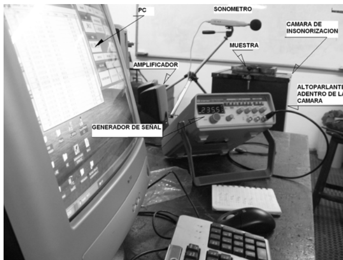
Figura No. 3 Vista del montaje real del SM.

Con ayuda del software se hace la recolección y almacenamiento de los datos para su posterior análisis. El procedimiento se repite para cada uno de los materiales. Tomar por lo menos 20 mediciones en cada una de las frecuencias de 250, 500, 1000, 2000, 4000 y 8000 Hz. Teniendo en cuenta que el recinto en donde se realizaron las pruebas no tiene recubrimiento contra ruido, es recomendable realizar las pruebas en las horas de la noche, para conseguir que el sonido de fondo sea el menor posible, además, no realizar pruebas cuando está lloviendo, ya que el ruido de fondo se incrementa demasiado.