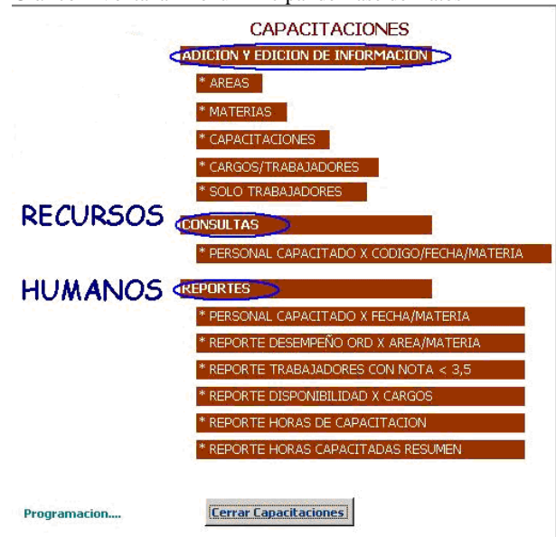
Gráfico 1 Ventana- Menú Principal de Base de Datos

Los datos ingresados al sistema de la forma anteriormente descrita, permiten hacer consultas a cerca de históricos de capacitación de cada uno de los empleados, generar reportes que totalizan y consolidan la información de toda la organización, accediendo en tiempo real el estado actual del proceso de capacitación en la planta. Esta herramienta facilita el mejoramiento de los niveles de eficiencia del proceso de capacitación, eliminando las quejas de los clientes internos, operarios y empleados, por inconsistencias en la información, disminuye los tiempos y recursos requeridos para la planificación y programación de las capacitaciones sin causar interrupciones significativas en la producción, y lo más importante permite medir, controlar y hacer seguimiento de la formación del personal, con destino a la toma de decisiones estratégicas a nivel administrativo en la empresa.