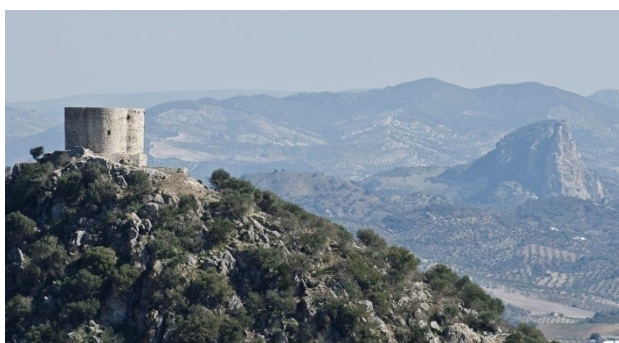
Fig. 1 : Castillo de Cote y Peñon de Zaframagón

De la época árabe se conocen bastantes datos proporcionados por los historiadores y los geógrafos de la zona de Morón 4 y sus alrededores, y de los militares asentados en su fortaleza. No se cita Montellano, ni Cote, en los dos primeros siglos de al-Andalus, pero deducimos que algunos bereberes estarían ya poblando esa zona, que está próxima al R. Guadalete. Sí son mencionados los moroneros desde antes de la llegada de o Abd al-Rahmān el Inmigrante, quien instauró la dinastía omeya en al-Andalus independiente de los califas abasíes, en el año 756. En este año le ayudaron a derrotar al anterior gobernador de al-Andalus, Yūsuf al-Fihri, quien acababa de traicionar el pacto acordado con el omeya y su jura de obediencia, y, en cambio, se rebeló y decidió conquistar Córdoba, que ya estaba en manos de o Abd al-Rahmān 5 .