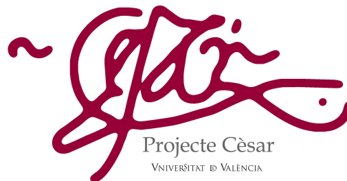
Fig 2. Logo del Projecte Cèsar.

A cambio de la digitalización, Proquest/UMI conservará una copia del documento para su comercialización a través de su base de datos ProQuest Dissertations & Theses A & I, asignando a cada una de las tesis un ISBN. Por otro lado, facilitará otra copia a la Universitat de València que podrá ser distribuida en abierto a través del repositorio institucional.