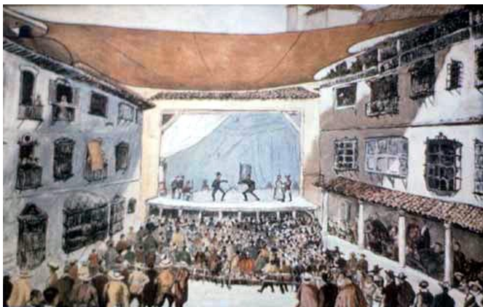
Dibujo de Comba representando el teatro del Príncipe

Podemos apuntar ese año y el día 17 de noviembre como fecha principal en la que el Consejo de Castilla autorizaba la presencia de actrices en los escenarios, o dicho de otra manera, levantaba la prohibición de un decreto anterior por el cual la Junta de Reформación ordenaba “a todas las personas que tienen compañías de representación no traigan en ellas para representar ningún personaje mujer ninguna, so pena de zinco años de destierro del reyno y de cada 100000 maravedis para la Camara e Su Majestad” 3