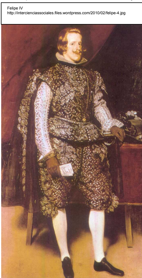
Felipe IV

Como ésta, oficio desde la llamada escala de papeles saltaría, hacer y su voz dama que tendría el escenario con el representar estos con la que pasó a formar parte de la historia del teatro.