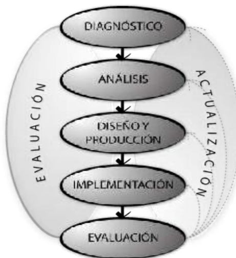
Gráfico 2. Metodología propuesta para el SEDLUZ

A continuación, se presenta la propuesta metodológica para la elaboración de los programas académicos adaptada al Sistema de Educación a Distancia de la Universidad del Zulia (SEDLUZ). Esta definición es utilizada por la dependencia y fue descrita en función de los fundamentos teóricos que rigen la materia. De tal manera, en primera instancia se definirán las fases del modelo con la finalidad de comprender el alcance y naturaleza de cada una de ellas. Ver Gráfico 2.