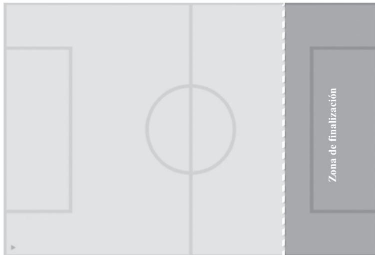
FIGURA 1: Delimitación de la zona de finalización

equipo observado dispone de la posesión de la pelota en dicha zona (Figura 1), por tanto, queda fuera del objeto de estudio del presente trabajo.