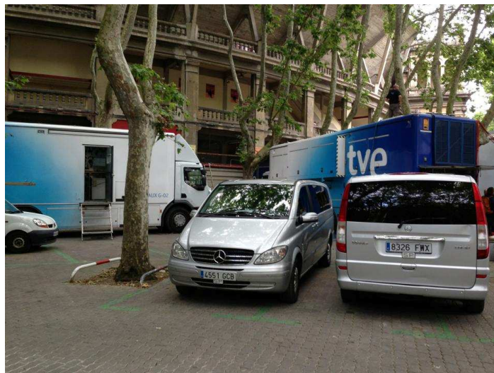
Figura 5. TV compound (área de estacionamiento de unidades móviles)

José Ramón Díez, realizador especializado en retransmisiones olímpicas es tajante cuando afirma: "Comprender que una posición de cámara puede ser imprescindible, lo mismo que una cierta iluminación o el estar sujeto a un horario muy exacto sería de gran ayuda".