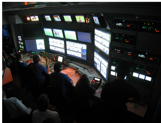
Foto 2. Control de realización de la Unidad Móvil nº 25 de Mediapro

De la misma forma que un realizador adaptará su planificación técnico-artística en base a los factores que determinan el protocolo, los responsables de la organización de un acto deben adecuar sus planteamientos en base al conocimiento previo de las normas y fundamentos de la narrativa audiovisual. Y no solo en lo referente al lenguaje, sino también atender a las necesidades logísticas de la producción de televisión. "Resultaría útil que supieran cómo se planifica la retransmisión de un programa de televisión, cómo se lee una escaleta, la importancia del respeto a los tiempos, cuales son los distintos perfiles profesionales que participan en la retransmisión de un evento, desde el regidor al realizador, pasando por los cámaras, responsables de sonidos, responsables de scroll o del autocue, etc. Y por supuesto, resulta imprescindible que posean nociones básicas sobre términos que se utilizan en los equipos de trabajo televisivos y que contribuiría a realizar un mejor seguimiento del proceso de retransmisión o grabación de un evento televisivo", afirma el realizador del grupo Mediapro. En esta misma línea, Rupérez señala "hay que poseer un conocimiento más exacto de lo que es la realización televisiva".