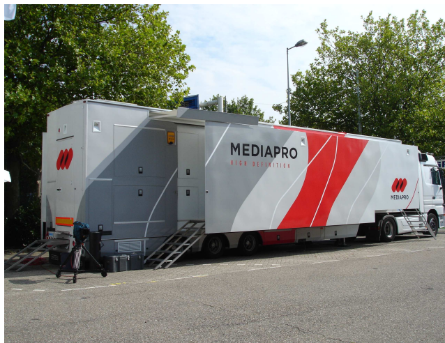
Figura 4. Unidad Móvil (large)