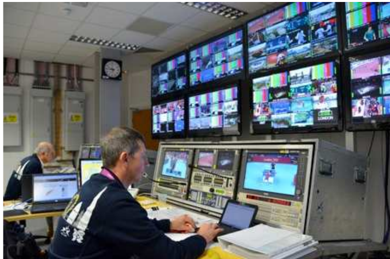
Foto 1: Control de transmisiones de EBU/UER en los JJ.OO de Londres, 2012