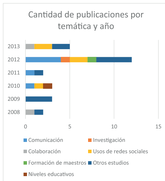
Fig 1. Cantidad de publicaciones por temática y año