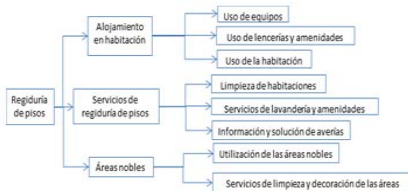
Figura 3: Diagrama Árbol que relaciona los momentos de verdad para el subproceso de Regiduría de Pisos

Los momentos críticos de verdad para Regiduría de pisos son: Alojamiento en habitación, Servicios de regiduría de pisos y Áreas nobles. Dentro de los tres momentos de verdad identificados se selecciona Alojamiento en habitación, al que se le aplica la metodología propuesta porque genera el mayor número de quejas en los clientes externos. Los Momentos de Verdad a evaluar son los obtenidos en el segundo nivel del Diagrama Árbol.