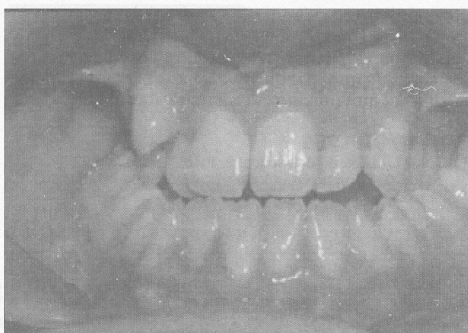
Foto 1. Paciente incluido en el estudio.

El desplazamiento condilar se midió con galgas calibradas de 0.1 mm previo montaje de modelos en un articulador semiajustable SAM II. El modelo superior se transfirió con eje arbitrario de bisagra y el inferior con un registro de mordida realizado en cera rosa Moyco extradura de un solo grosor. Los movimientos de lateralidad se registraron con el mismo material, alternativamente en uno y otro lado, posicionándose posteriormente en el modelo inferior para ajustar en seguida el modelo superior sobre las indentaciones y valorar el desplazamiento condilar (Foto 2).