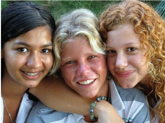
Figura 2. Propiedad del autor.

Es necesario precisar acciones orientadas a que la educación secundaria fomente el desarrollo pleno de las personas, la equidad e igualdad, el respeto a la diversidad, la construcción del conocimiento y de la acción basado en los derechos humanos.