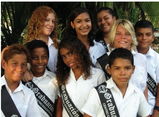
Figura 4. Propiedad del autor.

Los niños y las niñas que ingresan al colegio provienen de instituciones educativas de Educación Primaria, las cuales contrastan radicalmente con el modelo educativo prevaleciente en la secundaria.