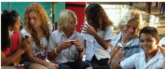
Figura 3.

Se comprende que aspectos, como los anteriormente descritos, constituyen condiciones comunes y en muchos casos inevitables; pero en cuanto a políticas educativas, resulta primordial la urgencia de valorar lo que sucede o no sucede en esta etapa decisiva, y consolidar propuestas educativas de mayor calado y eficacia.