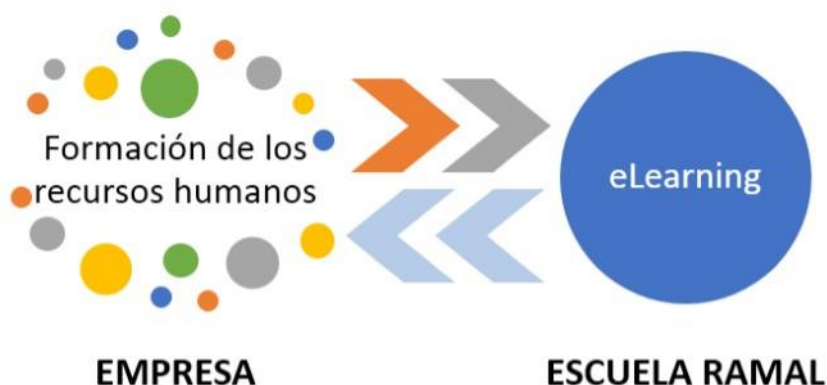
Fig. nº 1 Relación entre los procesos e-learning y formación de los recursos humanos .

La escuela ramal, habituada a desarrollar un proceso formativo eminentemente áulico, necesita de una estrategia pedagógica para desarrollar el e-learning , entendiendo está como una concepción teórico-práctica de la dirección del proceso pedagógico que, durante la transformación del estado real al estado deseado, condicione el sistema de relaciones sociales de los sujetos de la formación y el sistema de acciones para alcanzar los objetivos, en contextos sociohistórico culturales semipresenciales o no presenciales .