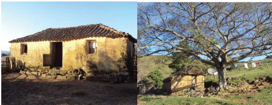
FIGURA 3 - Foto casa de pedra, a mais antiga da comunidade e casa coberta com capim Santa Fé

As casas são pequenas, com poucas peças, e a pouca luminosidade deve-se ao número reduzido e ao pequeno tamanho das portas e janelas. As casas, muitas delas centenárias, são de barro ou pedra, com cobertura de capim Santa Fé (Figura 3), ou de alvenaria e madeira. É relevante destacar que a energia elétrica é recente, e em algumas casas ela ainda não chegou. No que se refere à existência de jardins e pomares, importantes símbolos territoriais camponeses, eles não são significativos, ou praticamente inexistentes, o que se justifica pelas características culturais e pelos limitantes ambientais, comentados anteriormente.