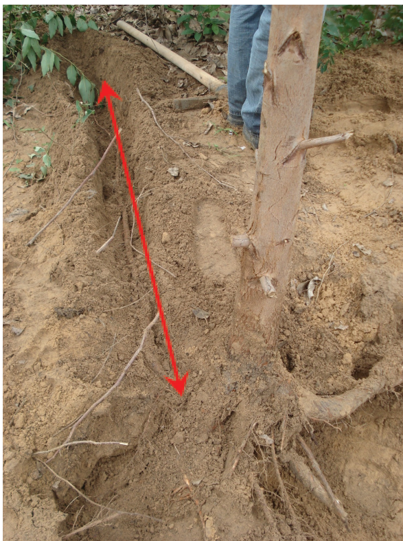
Figura 3 - Foto de um eucalipto vivo cultivado em solo coeso. Observa-se que a raiz cresce na horizontal, muito próxima à camada superficial do solo, o que pode causar instabilidade à planta e problema na troca de nutrientes.

No caso do plantio do eucalipto, nas áreas onde ocorre o solo coeso (geralmente entre os 20 a 150 cm de profundidade), as raízes, por não conseguirem ultrapassar a camada adensada, tendem à horizontalização, deixando a planta mais frágil diante de intempéries naturais (Figura 3).