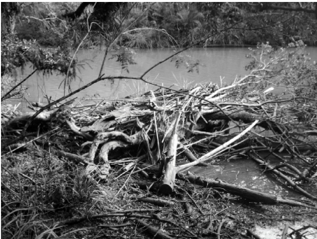
Figura 2. Acumulação de meandro encontrada no Rio das Pedras.

Segundo Montgomery et al. (2003), dependendo do tamanho da árvore e do tamanho do rio, ela pode permanecer estável próximo onde caiu no canal ou pode ser transportada à jusante, podendo alojar-se contra a margem ou uma acumulação de detritos lenhosos pré-existente, estagnar-se no leito (membro-solto), ou ainda ancorar-se sobre uma barra ou sobre a planície de inundação.