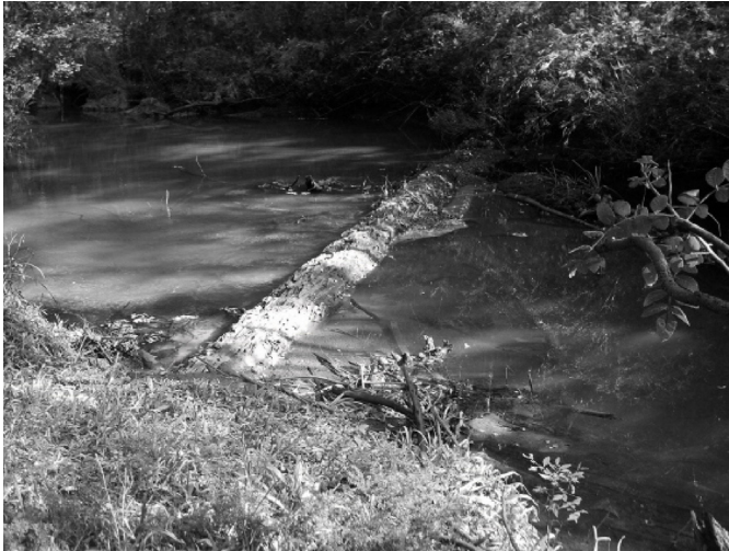
Figura 5. Degrau de detrito no Rio Guabiroba.

detrito é formado pelo tronco de uma Araucaria angustifolia , à montante do qual há retenção de sedimentos. O Rio Guabiroba, sobretudo nesses trechos de baixa declividade, por possuir um canal estreito, em relação ao Rio das Pedras, é muito propenso a apresentar degraus de detrito.