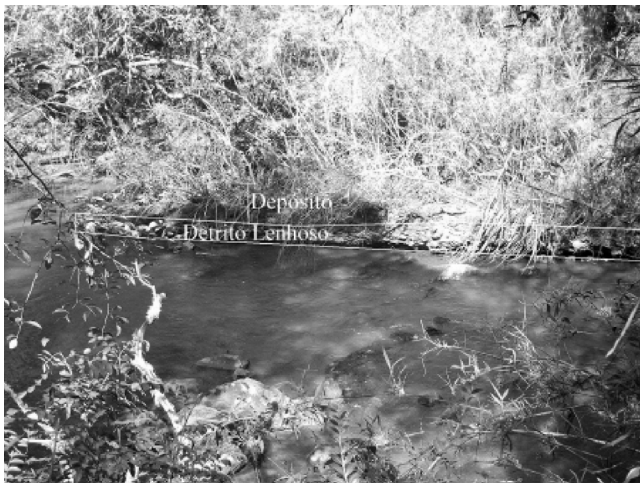
Figura 3. Acumulao6o de margem (notar dep6sito formado sobre o detrito lenhoso).

O membro-chave passa a atuar no revestimento da margem contra a eros6o, contudo, sua funo6o principal refere-se 6 capacidade de reteno6o do material transportado em suspens6o (part6culas finas – silte e argila) e de pequenos detritos lenhosos (ABBE & MONTGOMERY, 2003). No Rio das Pedras, foram encontradas ocorr6ncias desse tipo de acumulao6o de margem ( Bench jams ), como se v6 na Figura 3. No caso observado, um detrito chave, constitu6do por um tronco de Arauc6ria angustifolia , encontra-se definitivamente est6vel, com um dep6sito de sedimentos finos formado sobre a peo6a e entre a peo6a e a antiga margem, sustentando o desenvolvimento de vegetao6o de porte arbustivo.