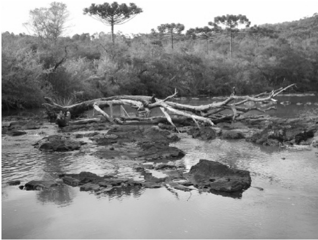
Figura 1. Grande detrito lenhoso encontrado no Rio das Pedras.