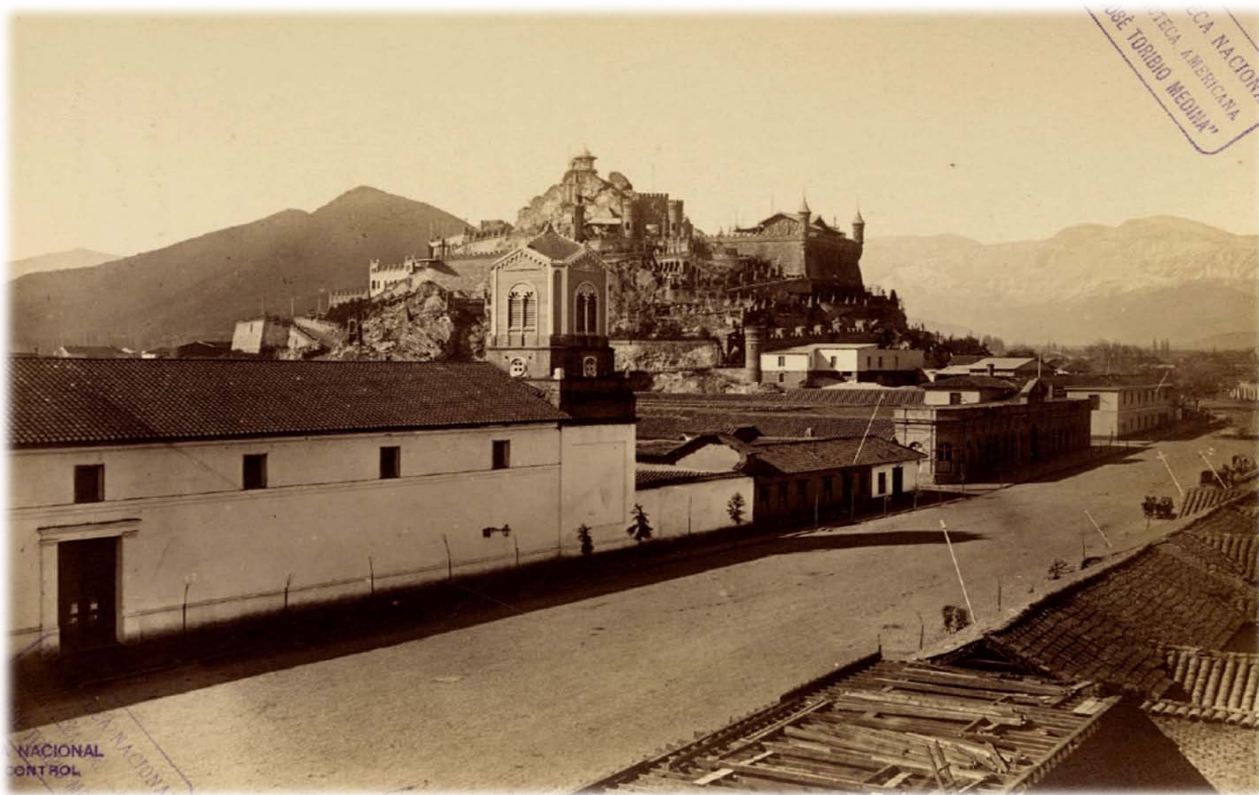
Paseo Cerro Santa Lucía. Vista desde la Alameda Fuente: "Album del Santa Lucia: colección de las principales vistas monumentos, jardines, estatuas i obras de arte de este paseo: dedicado a la Municipalidad de Santiago por su actual presidente B. Vicuña Mackenna". 1874.