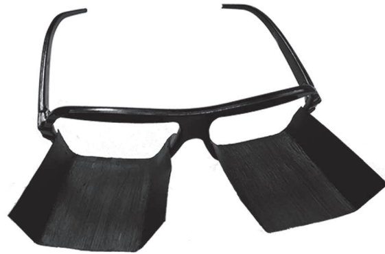
Figura 1. Dispositivo de reducción del campo visual. Dispositivo de bloqueo visual empleado para evitar que la percepción del color interfiera en el reconocimiento del estímulo gustativo durante la lectura de la pantalla de la computadora.

Un grupo recibió palabras (Grupo 1) y el otro grupo recibió anagramas (Grupo 2) de manera simultánea con la administración de los estímulos gustativos. La consigna requería que el participante verbalice el estímulo gustativo que estaba degustando en el menor tiempo posible mientras observaba la computadora. Las respuestas de identificación del participante eran registradas por un experimentador en cada ensayo.