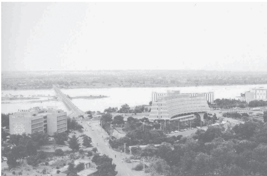
Fig 2. El río Níger a la latitud de Niamey. El puente John F. Kennedy es el único existente en un área de doscientos km.

El elemento del paisaje más relevante en este sector es el curso del río Níger. Dicho río nace en los contrafuertes del macizo del Futa-Djalon y su curso superior recorre el Malí, hacia la depresión norte, creando un delta interior, que se inunda durante el período de lluvias. Prosigue luego hasta alcanzar la mítica ciudad de Tombuctú; ahí el río sigue hacia el este, donde antiguamente formaba un inmenso lago (lago del Asawagh) que se evaporó a fines del Terciario y dejó fósiles de la antigua fauna ictiológica, trazas de su limnología y, más tardíamente, de las