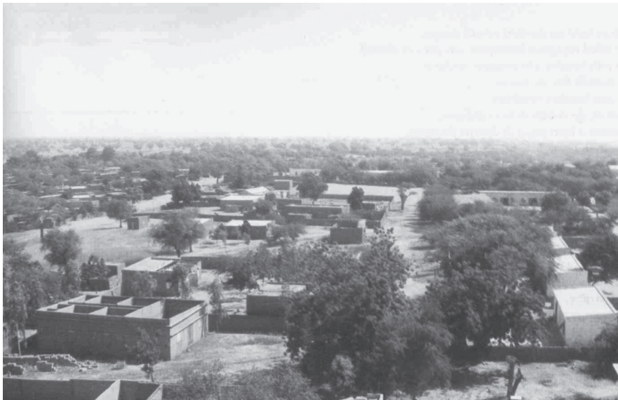
Fig. 4 Poblado de Madauá, 200 km al este de Niamey

El norte del país está dominado por el desierto del Teneré, que se caracteriza por sus ergs (grandes campos de dunas) siempre en movimiento, y por efectos eólicos se prolonga hacia el este por el Gran Erg de Bilma. Es en el