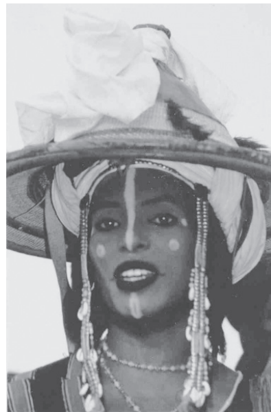
Fig. 7. Mujer y hombre de la etnia Peul. El maquillaje de los hombres es para atraer a las mujeres que son las que escogen al marido durante ceremonias colectivas anuales.