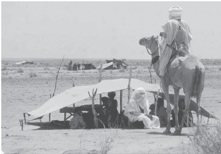
Fig. 6. Campamento Tuareg en algún lugar del Sahel.

Los Túbus del Chad, grupo negro del desierto, se caracteriza hasta hoy por sus fechorías. Es un pueblo semi-nómada.