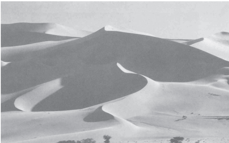
Fig. 5. Gran Erg del Teneré En primer plano algunas acacias que logran sobrevivir en esta gran aridez.

El 95% de la población es negra y de confesión musulmana. Guarda sin embargo un profundo arraigo animista. Conviven diversos grupos étnicos, donde cabe citar en primer lugar a los Tuaregs (señores del desierto), nómadas del desierto del Teneré que vivían hasta hace poco en estado insurreccional ( Decoudras P.M et alt. 1995). Hoy son sedentarios en su gran mayoría y viven de la ganadería caprina, así como de la artesanía (platería, talabartería). Orgullosos, desde lo alto de sus dromedarios desprecian a los otros grupos étnicos que fueron sus esclavos.