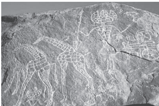
Fig.3. Cazador de jirafas en carro de dos ruedas, Iwelen, Níger.

Es muy probable que desde la antigüedad la región haya sido visitada desde el Egipto faraónico. Prueba de ello son las pinturas rupestres del Macizo del Air donde aparecen representados carros tirado por caballos, atribuidos a un pueblo denominado Garamantes .( Las dataciones al C14 que fueron realizadas en tumbas de Iwelen en el año 1980 arrojaron una edad que oscila de -3.600 a -2.100 años). Dichos carros evocan aquellos de los hicsos, (pueblo bárbaro que invadió el delta del Nilo e introdujo el caballo en Egipto y que fundó Avaris, su capital en el delta.