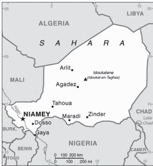
Fig. N° 1. Mapa de la República del Níger en África Occidental

En este sector existen poblaciones de Baobab , (“ Adamsonia digitata ”), árboles cuyas semillas en vainas nutren al ganado vacuno y caprino que son la riqueza tanto de grupos nómadas (Peuls y Touaregs) como de rurales sedentarios (Zarmas, Hausas, ...)