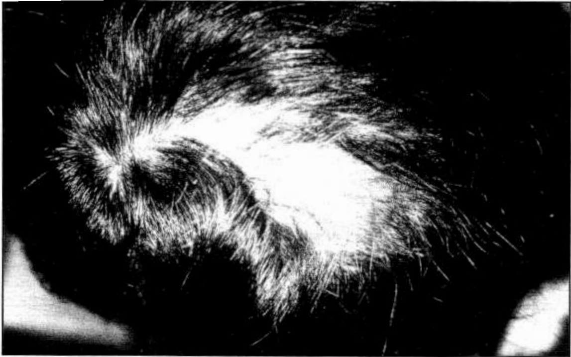
Fig.2: Tiña tonsurante. Tipo tricofítica. Placa de límites difusos con pelos sanos de por medio.

Diagnósticos diferenciales son la alopecia areata (no presenta descamación), la dermatitis seborreica (más difusa y la descamación es adherente al pelo pero no lo fractura), la psoriasis (no hay pelos rotos). En las tiñas inflamatorias, la piodermitis (6) .