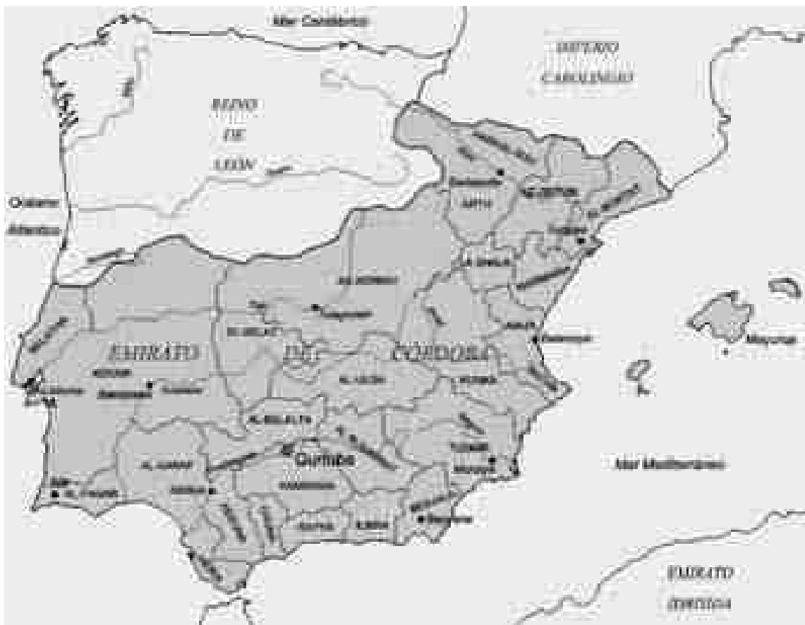
Figura 2. Plànol indicatiu de la geo-estratègia dels dos blocs hegemònics.

trument regi de control dels nous territoris fronterers, substituirà l'antiga autoritat eclesiàstica tarraconense a la zona.