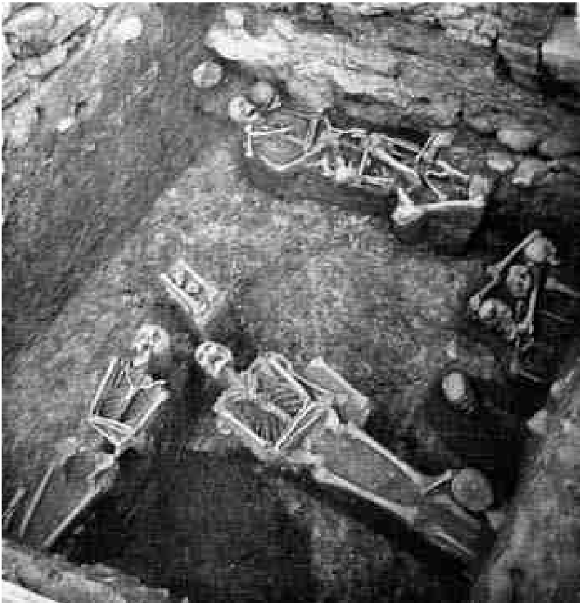
Figura 5. Enterraments localitzats davant la porta de la sala de la cúpula (Schlunk/Hauschild, 1962: Làmina XXIX).

No obstant, les excavacions dels últims anys, han tret a la llum importants evidències materials d'època medieval en les proximitats de la vil·la romana. Durant els anys 1996-1997, sota la direcció de J.A. Remolà, s'han dut a terme diversos sondeigs arqueològics en els límits que avui ocupa el monument. Aquests treballs es van localitzar en un espai anteriorment sondejat per l'IAA, al sud de l'edifici i a prop del molí paperer. Schlunk va identificar un mur fet amb pedra seca, que acompanyava tres grans sitges reomplertes amb pedres, elements ceràmics dels segles XII o XIII i, per últim, una moneda d'Alfons II d'Aragó (1157-1196). En aquesta zona, Remolà va efectuar dos sondeigs més (núm. 100 i 200), en el sondeig 200 va documentar una