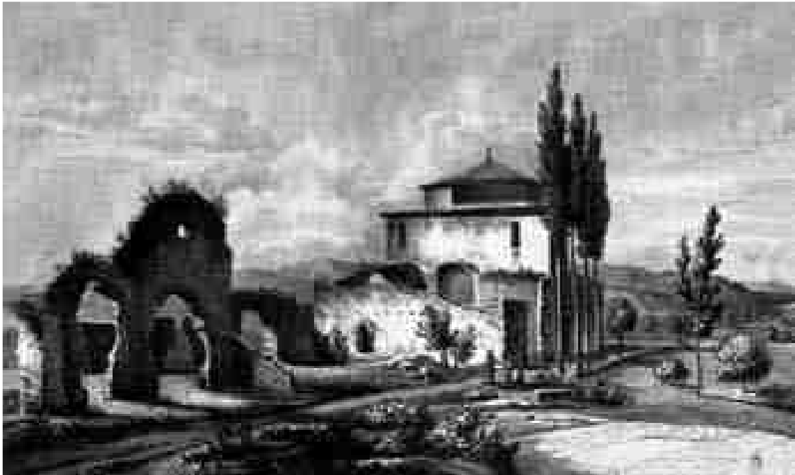
Figura 10. Centelles a començaments del segle XIX, segons A. De Laborde (Massó, 2013: 33).