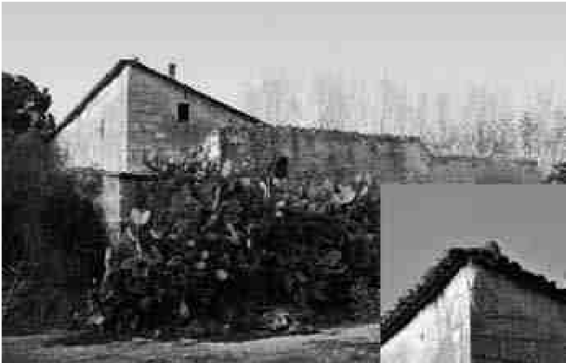
Figura 8. El Molí de l'arquebisbe. Detall de l'escut d'Ènnec de Vallterra (disponible en: http://www.constanti.cat/admin/fotografies/7642moli-de-constanti.jpg i http://www.constanti.cat/admin/fotografies/18308foto-del-moli-de-constanti.jpg ).

Aquestes evidències porten a plantejar un poder municipal a Constantí, que predomina i governa sobre altres municipis propers, anteriorment independents. A part, també observem un nou pla econòmic que dinamitzarà el paisatge de Centcelles, en detriment del propi municipi: 1) enderrocament del primerenc urbanisme municipal en favor d'un aprofitament de les terres de conreu, 2) es comencen a erigir noves edificacions o reparacions d'aquestes com el pont de les Caixes, creant un nou circuit d'ai-