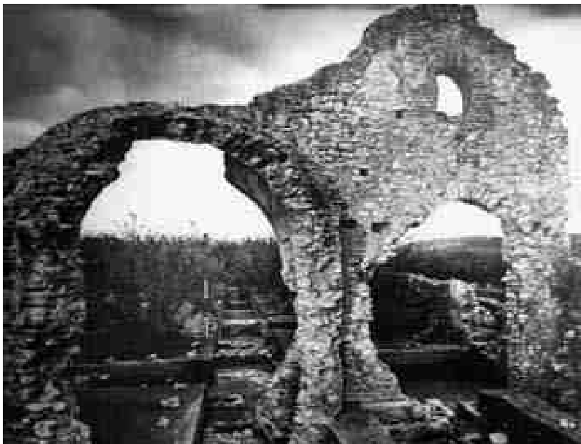
Figura 9. Detall de les excavacions en el sector est, l'any 1962.

És realment complicat establir conclusions fermes sobre la problemàtica municipal de Centcelles en les èpoques medievals, ja que a mesura que s'ha anat avançant en el procés d'estudi han anat sorgint molts més interrogants que possibles respostes. Un dels objectius principals ha sigut compilar el volum màxim de dades aportades pels investigadors/es precedents, per tal de valorar-les en conjunt i així poder assen-