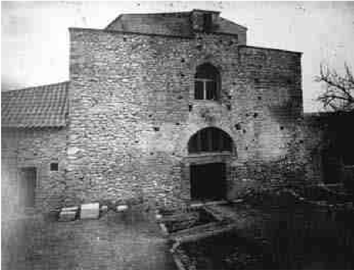
Figura 1. Excavacions de l'any 1962 a la façana principal. Fotografia de D.M. Noack (Arxiu de l'IAA de Madrid)].

La nova arqueologia medieval s'ha renovat en les problemàtiques d'aquest període històric, tot intentant assimilar la transició, al Camp de Tarragona, que tingué lloc amb l'arribada del poder islàmic fins a l'establiment cristià del comtat de Barcelona. Tradicionalment, aquesta transició s'havia vist en clau de ruptura i trencament social, convertint l'àrea d'influència de la Terrachone o Tarracona visigoda en un simple espai fronterer (una terra de ningú) entre dues potències hegemòniques al nord-est peninsular. Ningú residia en aquests espais en ruïna, i si algú ho feia, serien personatges desconeguts que deambulaven aïllats, sense sentit ni organització social complexa (Abadal, 1986: 317; Pladevall, 2013: 226). Actualment aquestes tendències "obscuristes" no són hegemòniques en el discurs històric i es comencen a obrir noves vies d'interpretació on els poders polítics, islàmic i cristià, pugnen contínuament per ocupar un territori fronterer. És en aquest espai, on societats minoritàries, però certament complexes (no podem menysprear cap organització social), desenvolupen les seves dinàmiques al marge dels poders majoritaris, possiblement mitjançant pactes i ocupant espais que no devien ser primordials en la geo-estratègia dels dos blocs polítics antagònics.