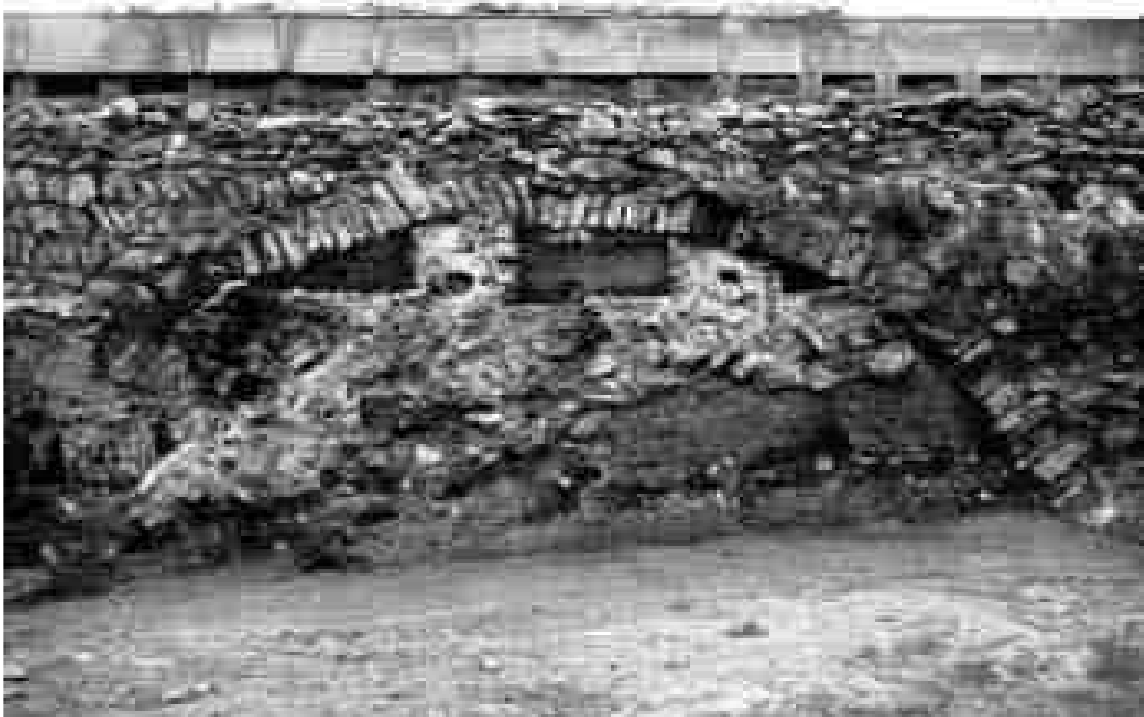
Figura 4. Detall on s'observa les diverses modificacions que es produeixen al Pont de les Caixes (Remolà/Aliende/Roig, 2011: 199).

En l'actualitat tenim documentats i localitzats al terme un conjunt de molins –el molí de l'arquebisbe (c. 1380 - 1407), posteriorment anomenat molí de Constantí; el Paperer (anterior al 1412), i el de Reus (anterior al 1471)–, però tots ells van ser construïts en una cronologia posterior. Hom podria pensar que el primer molí documentat al terme, el venut per Druïç, seria el que posteriorment s'ha anomenat molí de l'arquebisbe, però d'una fase arquitectònica anterior. El problema radica, com bé recorda Remolà, en com es trobava el Pont de les Caixes sense la remodelació del segle XIV. Coneixem, a partir dels treballs arqueològics efectuats, que la canalització sofrí una modificació en el seu traçat per permetre que l'aigua assolís l'alçada suficient i així arri-