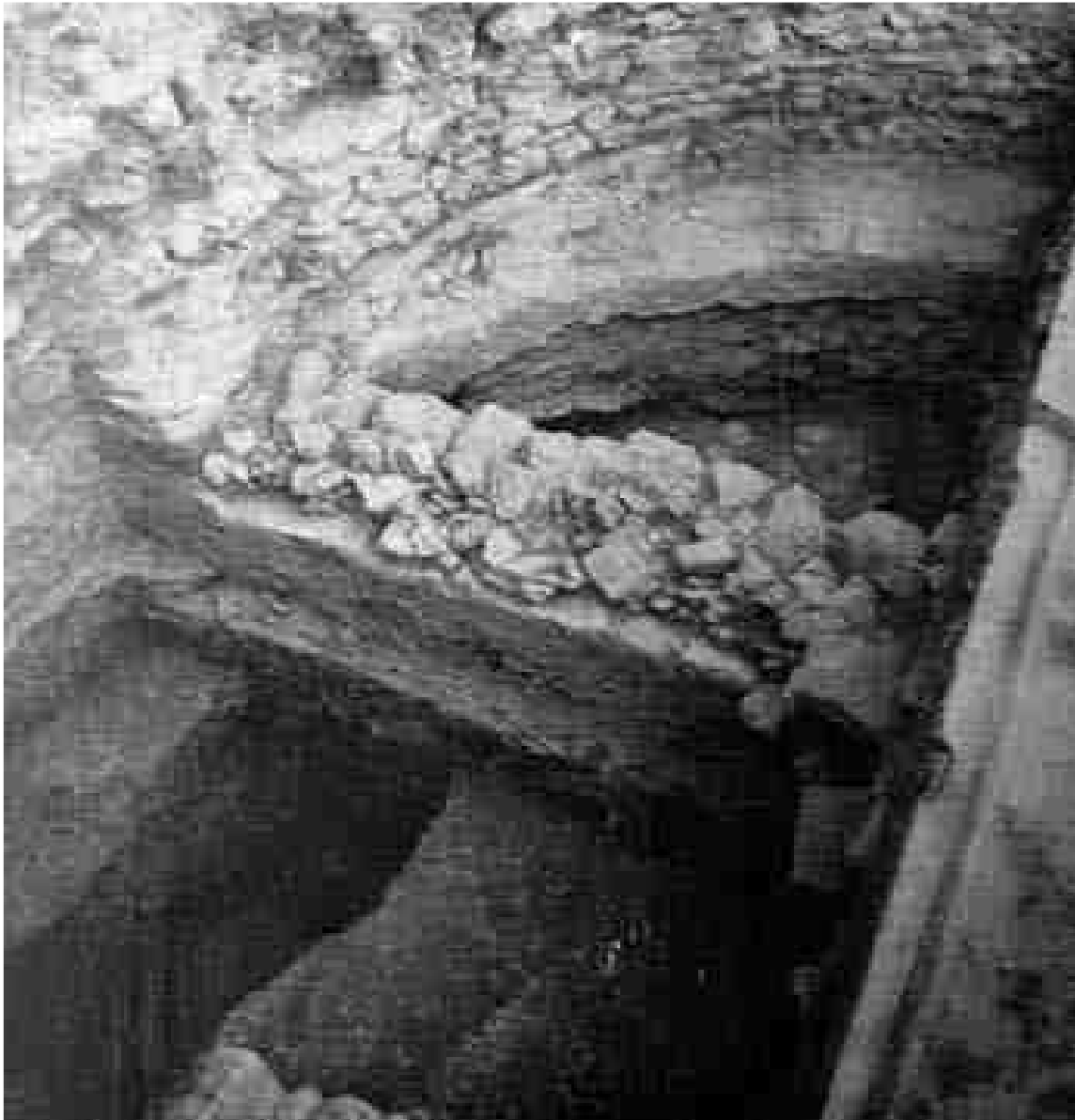
Figura 6. Detall de l'excavació a la sala VI (Schlunk/Hauschild, 1962: Làmina XXXII).

possible estructura i, al sondeig 100, un nivell amb materials aparentment anteriors al segle XIV (Remolà, 1998: 56). Altres sondeigs constataren estructures de pedres irregulars properes a l'edifici tardo-romà, materials ceràmics dispersos i material reutilitzat de l'antiga església per a la construcció d'un mur de limitació d'època contemporània. Per últim, els treballs realitzats en el jaciment l'any 2005 i 2006, sota la direcció també d'en J. A. Remolà i d'en Jacinto Sánchez, es van concentrar en l'estudi i anàlisi de la zona dels banys termals i de la bassa contemporània. Va ser en els banys on es trobaren noves evidències de murs medievals, a més de nivells de circulació fets amb terra compactada i còdols (Sánchez/Remolà, 2005-2006).