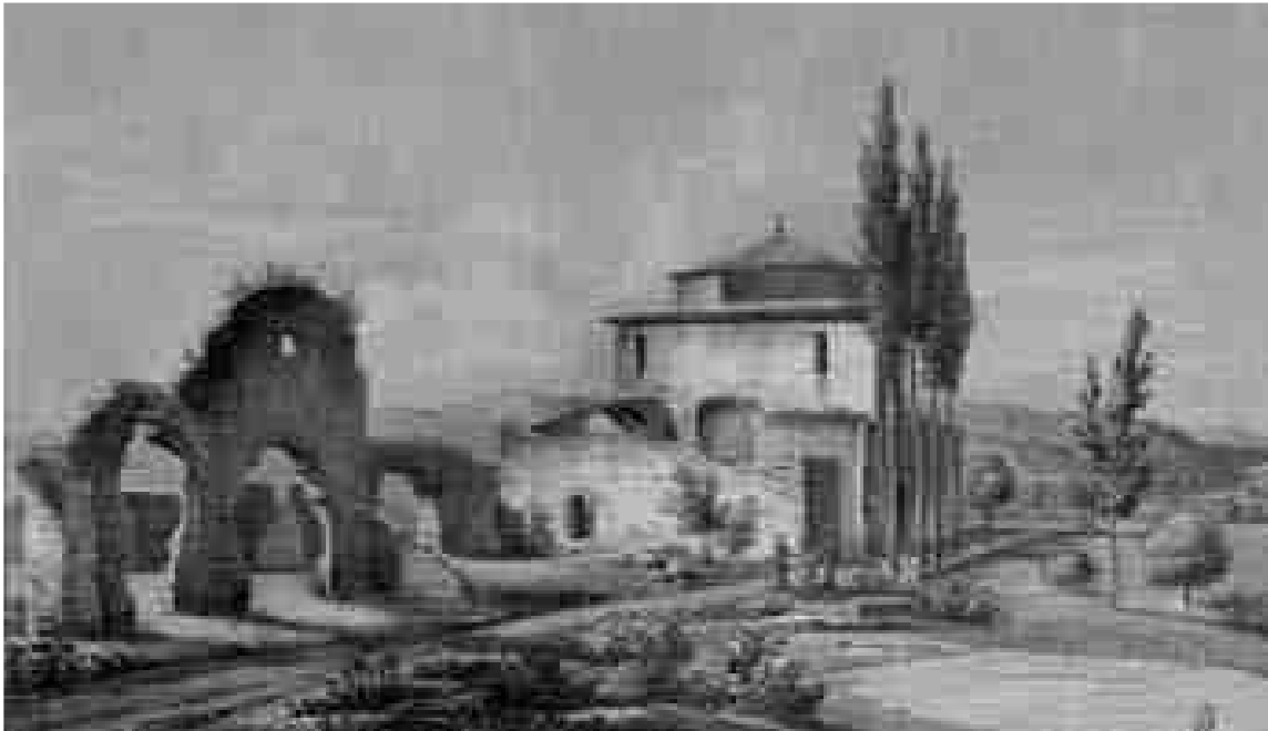
Centelles, al començament del segle XIX. Dibuix preparatori (no inclòs a l'edició) per al Voyage pittoresque et historique de l'Espagne , d'Alexandre de Laborde.

Carles IV– dels treballs de construcció del nou port tarragoní. (7) Laborde, molt assenyadament, i a més de la col·laboració del ja citat González de Posada, (8) cercà també la d'un altre important personatge tarragoní de l'època, el científic Antoni de Martí i Franquès (1750-1832), una col·laboració confirmada per l'esment que Laborde en va fer al seu llibre i per les dues cartes d'agraïment que li adreçà el 1805. (9) Posada i Martí, doncs, orientaren i facilitaren la tasca dels francesos.