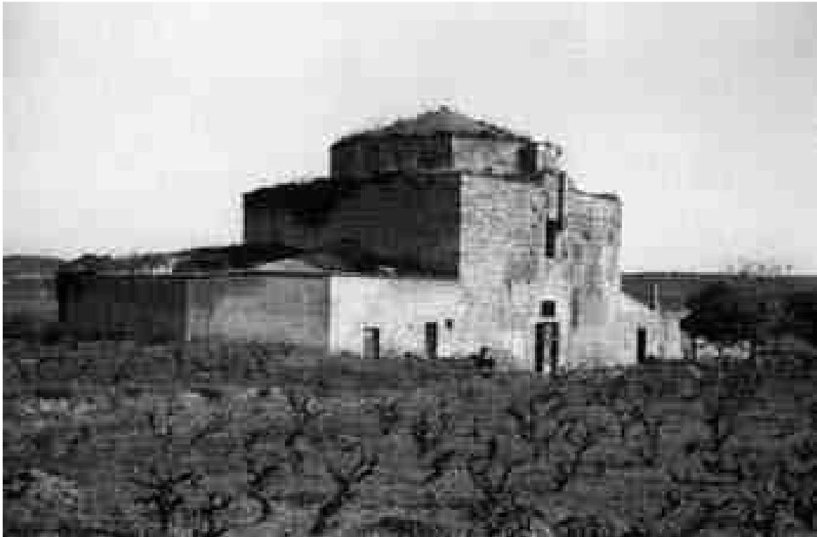
Centcelles, als anys quaranta del segle XX.

Laborde, Moulinier i Ligier van fer in situ un gran nombre de croquis, plantes, alçats i tota mena de dibuixos preparatoris dels principals edificis antics, medievals i moderns, i de diversos objectes de caràcter arqueològic (com escultures, inscripcions i àdhuc fragments de ceràmica), uns dibuixos que havien de servir per elaborar –ja a França– les planxes dels gravats que il·lustrarien l'ambiciosa obra. Un dels tres (potser Moulinier) es va desplaçar fins a Constantí i va dibuixar una esplèndida perspectiva del conjunt monumental de Centcelles. El dibuix de Centcelles, però, no va ser un dels finalment seleccionats per fer-ne un gravat i quedà a fora de l'edició impresa del Voyage , que esdevingué per a tot Europa el millor exponent –sobretot gràfic– de l'excelsionat monumental de Tarragona. Afortunadament, el dibuix original no es va perdre i es conserva actualment a la biblioteca de l'Institut National d'Histoire de l'Art (INHA), al fons procedent de la col·lecció de Jacques Doucet i amb el número d'inventari 20.869. No he tingut l'oportunitat de veure directament l'original, però del web de l'INHA, http://bibliotheque-numerique.inha.fr , he extret la imatge que acompanya aquest article i que és la més antiga que conec de Centcelles. (10) Segur que pagaria la pena de fer una edició facsímil d'aquest dibuix, a escala 1:1.