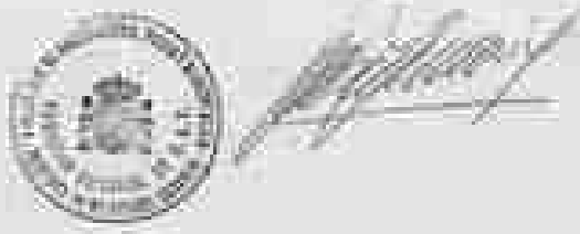
Inscripció de la Societat Agrària de Transformació "El Cotxo" al Registre de societats agràries.

Se me hace constar fehacientemente de que esta sociedad está inscrita en el Registro General de Sociedades Agrarias de Transformación, en virtud de la inscripción de esta sociedad en el Libro de Inscripciones de esta Register General, de folio 1, figura inscrita al Folio 1 de la hoja 5.000 en el Tomo 40 del Libro 2º, inscrita el día 22 de Mayo de 1967, la Sociedad Agraria de Transformación n.º 1.000 denominada "EL COTXO", con domicilio en TARRAGONA, inscrita en el Registro General de Sociedades Agrarias de Transformación con número de Cuenta 12 COND. 1967 (TARRAGONA), inscrita en el Registro General de Sociedades Agrarias de Transformación para transformación y mejora del campo.