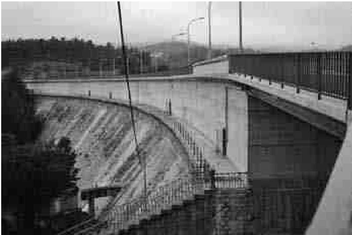
Pantà de Riudecanyes

El dia 23 de novembre de 1991 a les 12 del migdia, el President de la generalitat el Molt Honorable Jordi Pujol inaugura el recreixement de la presa de l'embassament de Riudecanyes.