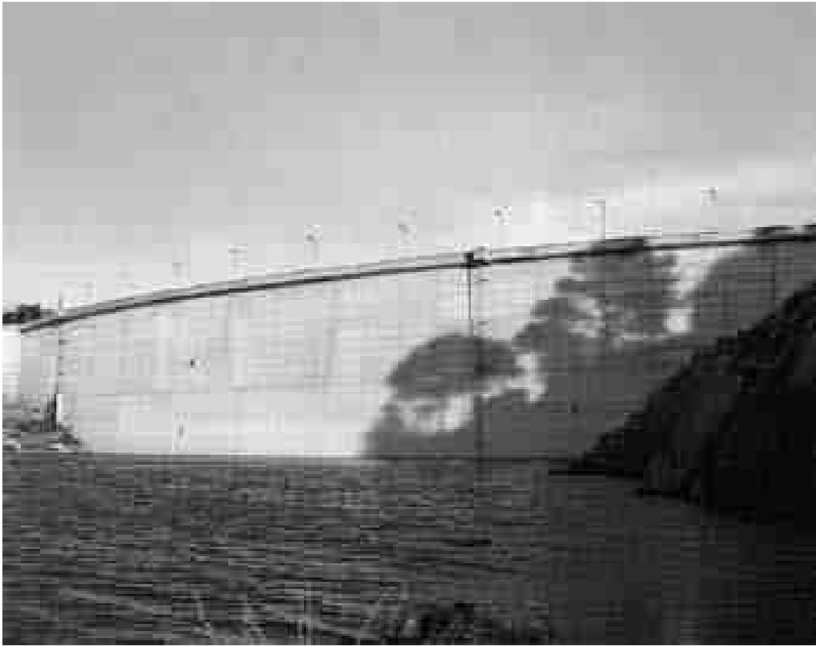
Pantà de Riudecanyes

estat la que va permetre, superant tota mena d'entrebancs dur a terme la construcció del pantà de Riudecanyes. Sorgida de l'empenta col·lectiva tot i que algun nom, com el de Pau Font de Rubinat, hi brilla amb llum pròpia, va haver de vèncer, per arribar a bon port, nombroses dificultats, però tanmateix la perspectiva històrica permet afirmar que l'esforç realitzat, no només l'econòmic, valia amb escreix l'èxit i l'agraïment de tots els ciutadans presents i futurs.