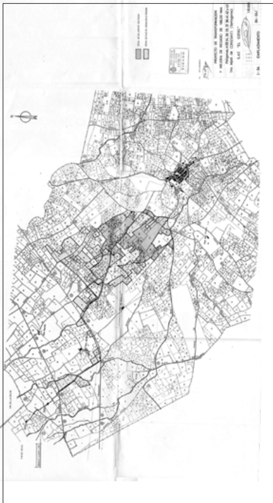
Projecte de transformació i millora de regadiu de la SAT "El Cotxo"