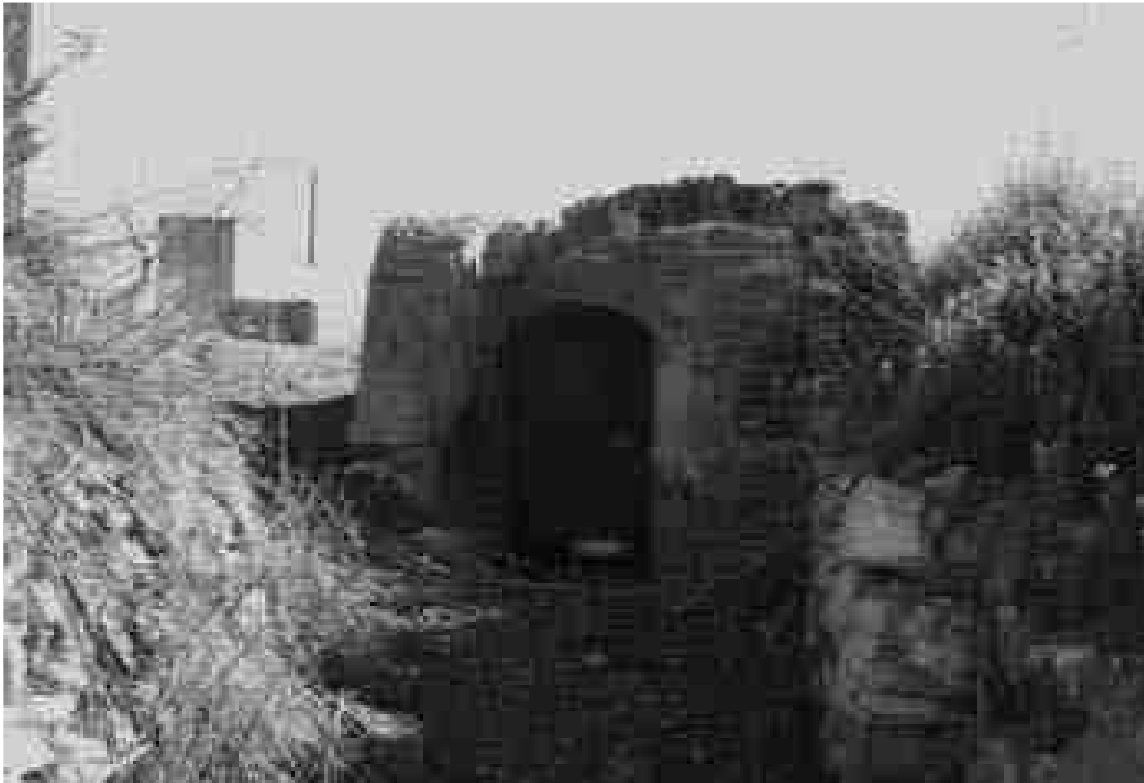
Boca de la mina o Cotxo

El moment que centrem l'eix de la història és al 1980, en plena febre de cultiu de l'avellaner, convertint zones de secà en regadiu amb el considerable augment de consum d'aigua que ens va portar a patir greus conseqüències.