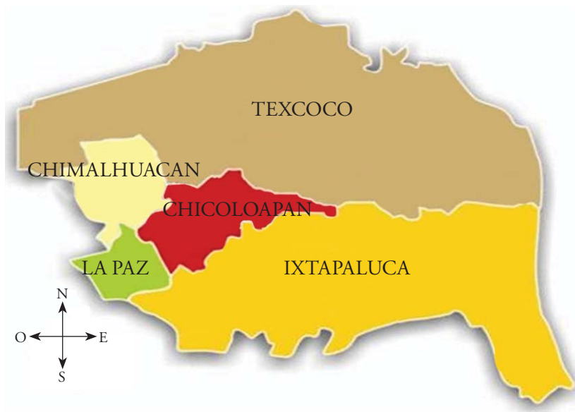
Mapa 1. Colindancias físicas

ro Chimalhuachi. Existe una ocupación urbana intensa e irregular en su parte norte como continuación de los barrios; se han incorporado al uso urbano predios con actividad agrícola. La zona comprende diez localidades.