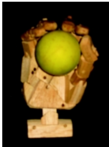
Maniobra de precisión