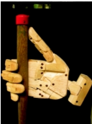
Posición de agarre