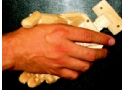
Despedida cara palmar