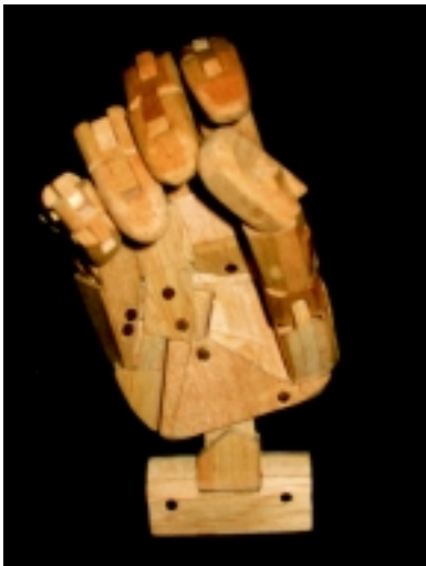
Trípode dinámico 1