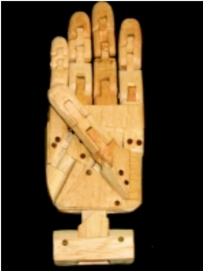
Rotación de pulgar