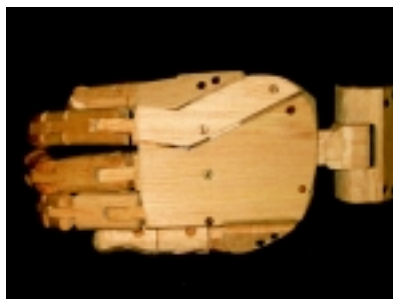
Visión de arcos longitudinal y transversales