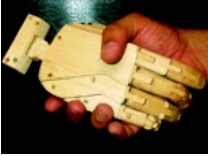
Despedida cara dorsal