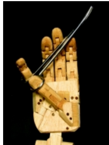
Trípode dinámico 3