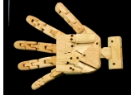
Abducción de la mano