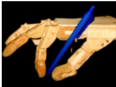
Trípode dinámico 2