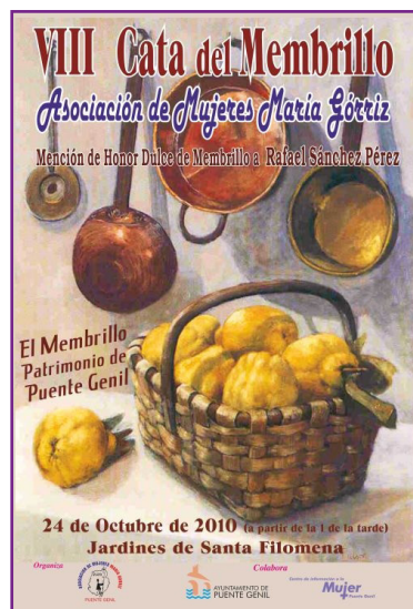
1. Cartel Cata de membrillo.