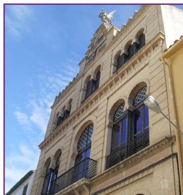
2. Antigua fábrica de electricidad La Aurora.