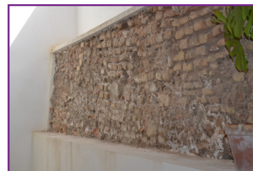
7. Muro membrillera integrado en nueva vivienda.