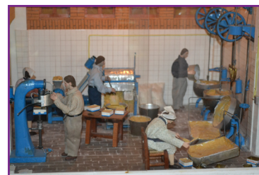
3. Maqueta de la fábrica de membrillo La Góndola. Museo de Puente Genil.