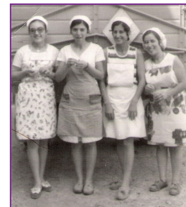
4. Mujeres membrilleras de la aldea pontanense de Sotogordo.