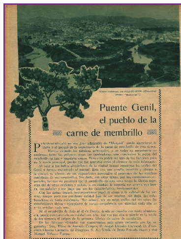
6. Recorte de prensa de época.