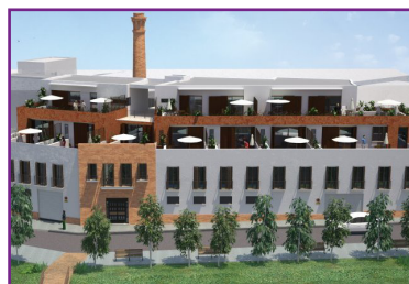
5. Edificio Río de Oro, que integra restos de una antigua membrillera. http://riodeoro.overblog.com/article-rio-de-oro-78580776.html