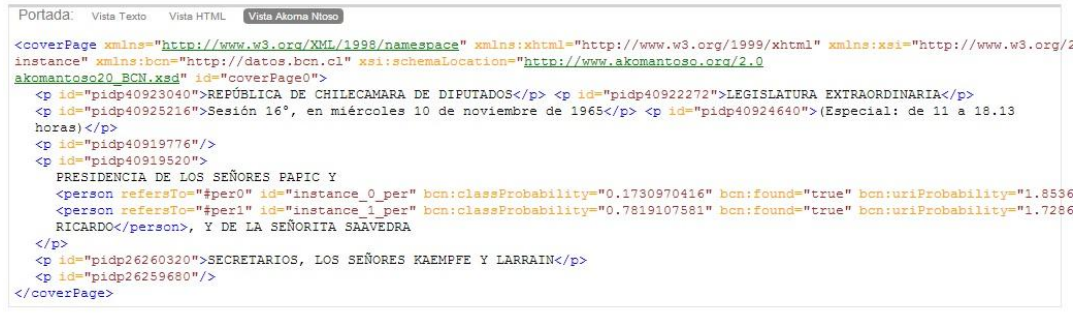
FIG 2. Vista portada Diario de sesiones de Chile en AKN.

pensado para el procesamiento del Diario de sesiones existente en ese momento en la Biblioteca fue traducido a ese esquema. 5