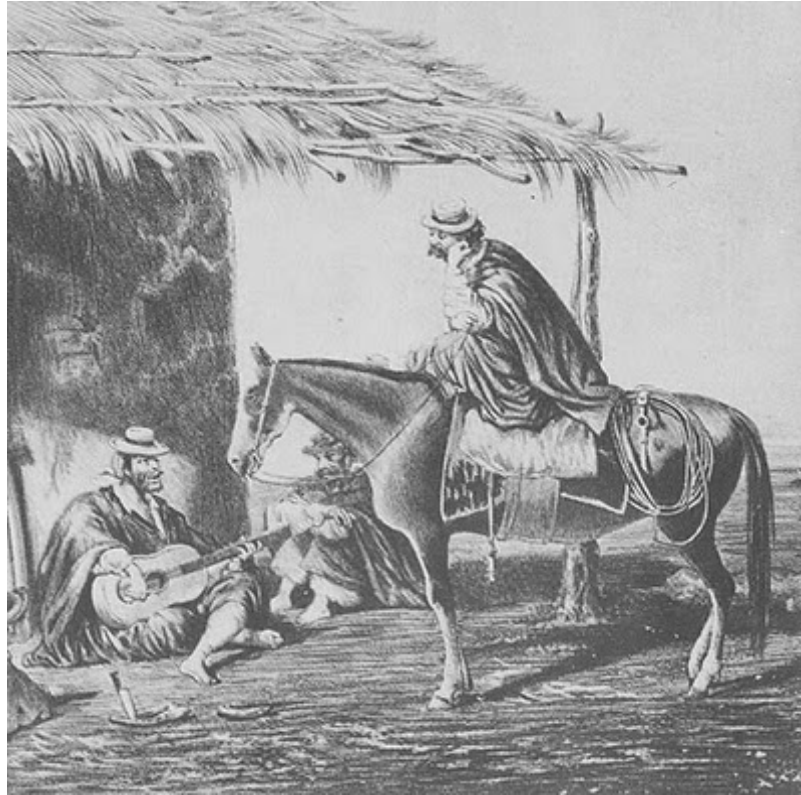
Fig 3 - Pulpéria de Campo