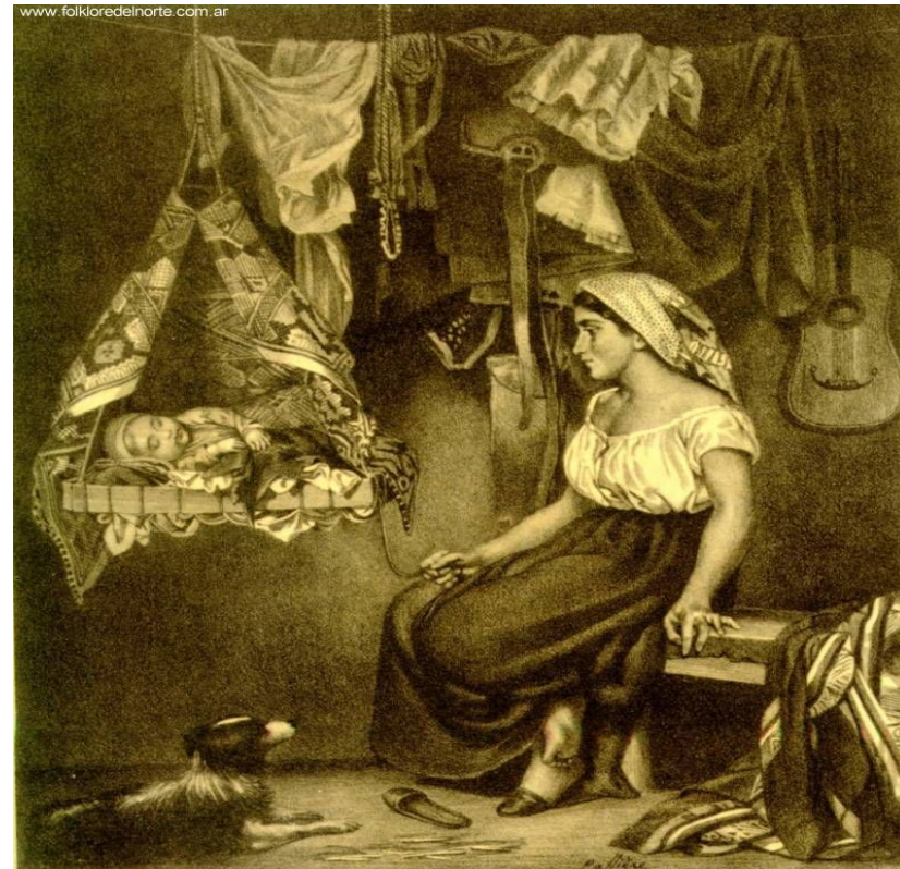
Fig. 4 - La Cuna

Na primeira tela, Pallière retrata dois gaúchos: um que está montado no cavalo - o modo com que está parado em cima do animal explicita uma feição de atenção para com o outro gaúcho - sentado, encostado à parede e com um violão nas mãos. Atenta-se para o fato da música (como na questão caipira, centro de tradições culturais) enquanto momento de diversão e de resgate das tradições, contudo, transparece o sentimento também de ócio e de desapego às questões que não sejam do âmbito rural; atrela-se a isso, outro lugar comum e de sociabilidade do gaúcho, a mercearia.