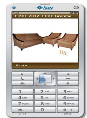
Gráfico 2. Juego de muebles.

Atiende a los elementos de usabilidad que se tuvieron en cuenta, el test realizado a la aplicación a través de su uso por algunos usuarios arrojó un 95% de satisfacción, lo que constituye un alto grado de aceptación por parte de los clientes. El problema principal en cuanto a la accesibilidad está dado a que la idea es que los usuarios puedan apreciar las obras de arte, por lo que las personas discapacitada visualmente no podrá obtener toda la información que se quiere brindar.