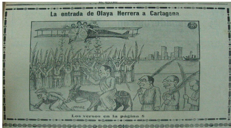
Figura 6. La entrada de Olaya Herrera a Cartagena.

liberal y disidentes de las campañas conservadoras, Olaya era el que salvaría a la nación de la catástrofe. Así se aprecia en una de las caricaturas publicada en el diario El Bateo (ver Caricatura N° 4), donde se observa al futuro presidente montar en un burro y a su alrededor la muchedumbre lo aclama levantando y sacudiendo las palmas de cera enardecidos por la llegada del nuevo Mesías , una representación de la entrada de Jesús a Belén. Esta caricatura le da una visión religiosa a la figura de Olaya Herrera, la masa popular, los diarios lo muestran con un ser que los salvará y les da esperanza.