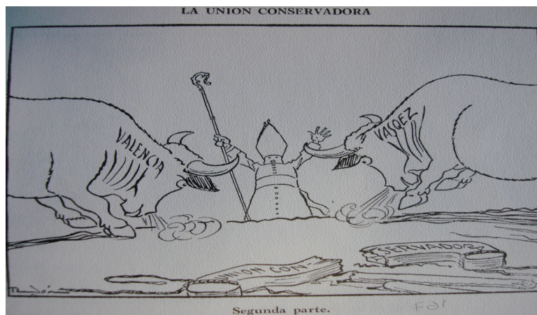
Figura 5. La unión conservadora. Segunda parte, por Ricardo Rendón

Fuente: Colmenares, Germán. 1984. Ricardo Rendón: Una fuente para la historia de la opinión pública . Bogotá: Fondo Cultural Cafetero.