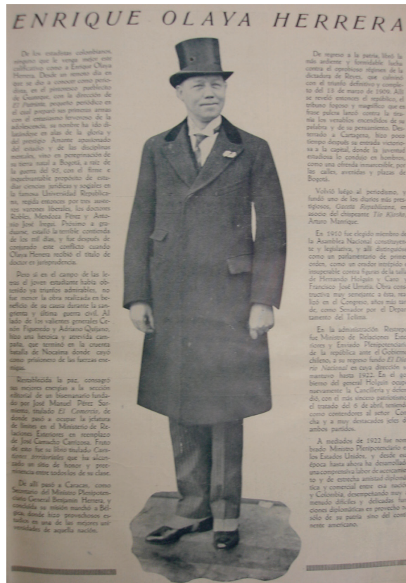
Figura 2. Enrique Olaya Herrera

Fuente: Enrique Olaya Herrera. 1930. Cromos , enero 1.