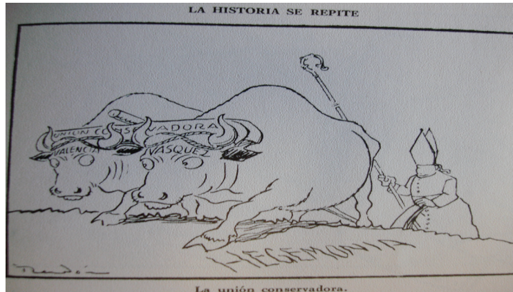
Figura 4. La historia se repite. La unión conservadora, por Ricardo Rendón