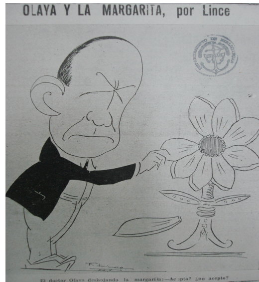
Figura 1. Olaya y la Margarita, por Lince

Fuente: Lince. 1930. El Heraldo de Antioquia . 13 de enero.