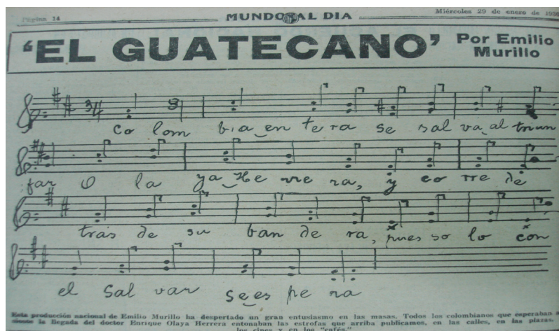
Figura 11. El Guatecano, por Emilio Murillo