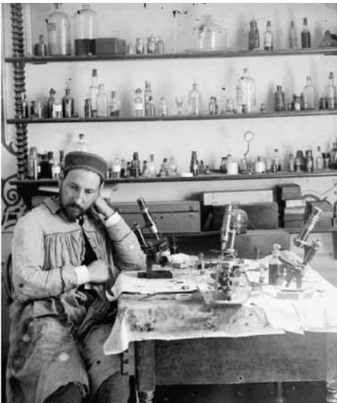
Foto 3: Santiago Ramón y Cajal en su Laboratorio de la Universidad de Valencia, en 1887, época en la comenzó a interesarse por los temas relativos a la sugestión hipnótica.

El prestigio científico alcanzado por Cajal, sobre todo después de la concesión del Premio Nobel en 1906 constituyó un auténtico imán que atrajo a una pléyade de alumnos que deseaban formarse como investigadores junto al maestro. De esta forma, desde el inicio de la década de 1910, comenzó a gestarse la denominada Escuela Neurohistológica de Cajal (Valenciano, 1977). Sin embargo, es preciso mencionar que entre sus discípulos, el grupo más numeroso de profesionales, excluyendo los propios histólogos e histopatólogos, fue el de psiquiatras (Peset, 1961) (Foto 3). Entre éstos hay que destacar a