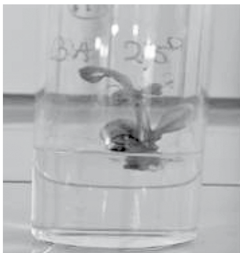
Brotes inducidos en la concentración de 2,5 mL -1 de BA.

De cada tallo de las plántulas de Cedrela salvadorensis en condiciones de invernadero, se obtuvo en promedio tres rebrotes de diferente longitud.