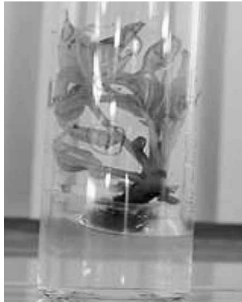
Brotes inducidos en estaquillas provenientes de plántulas de invernadero empleando la concentración de 2,5 mL -1 de BA.

semillera. Además, estas diferencias podrían deberse al genotipo (Perik, 1990).