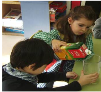
Leemos la receta del "Cóctel de carnaval" y medimos las cantidades exactas.