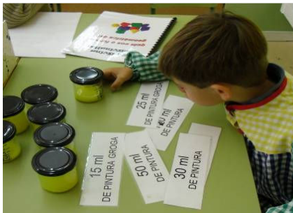
Rincón de los vasos: ordenemos por cantidad de líquido.