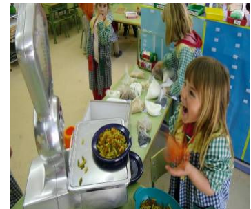
Rincón de la tienda: ponemos en práctica los conocimientos de medida aprendidos.