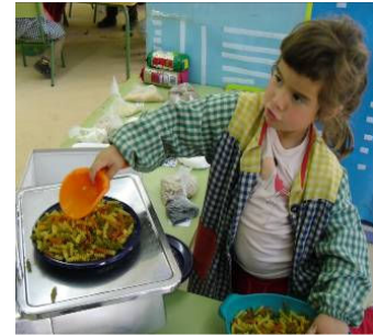
Por parejas leemos la receta y preparamos el "Menú de primavera".