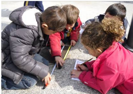
En la excursión a Lloret de Mar reconocemos formas geométricas, y medimos algunos objetos de la plaza con la cinta métrica.