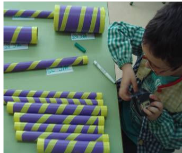
Hacemos práctica de medida en los distintos rincones. Rincón de cilindros: ordenamos por longitud y después por anchura.