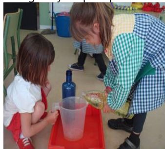
Rincón de los recipientes: medimos la capacidad de los recipientes.