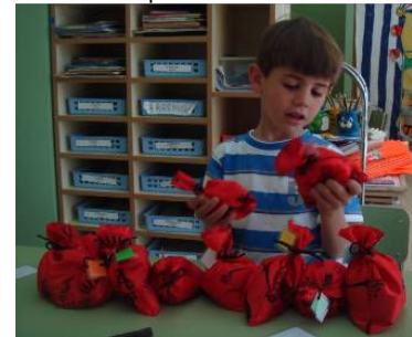
Rincón de las bolsas: ordenemos por masa. Primero a través del tacto y después con una balanza.