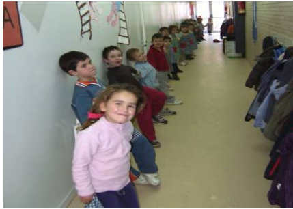
Medimos al pasillo con nuestros cuerpos