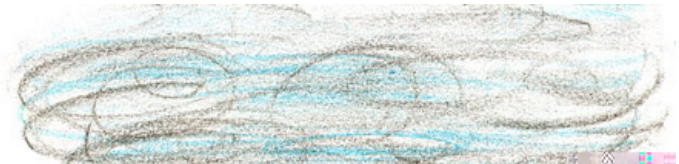
Figura 1. Comunicação gráfica do desenho-estória com tema 1

O primeiro campo de sentido, “Falha mecânica”, organiza-se ao redor da crença de que problemas sexuais masculinos ocorreriam em função de prejuízo no complexo mecanismo de funcionamento corporal, que poderia ser afetado por distúrbios orgânicos ou causas psicológicas, como a presença de ansiedade, angústias e dúvidas. Como exemplo de produção emergente deste campo, apresentamos o Desenho-Estória com Tema 1: