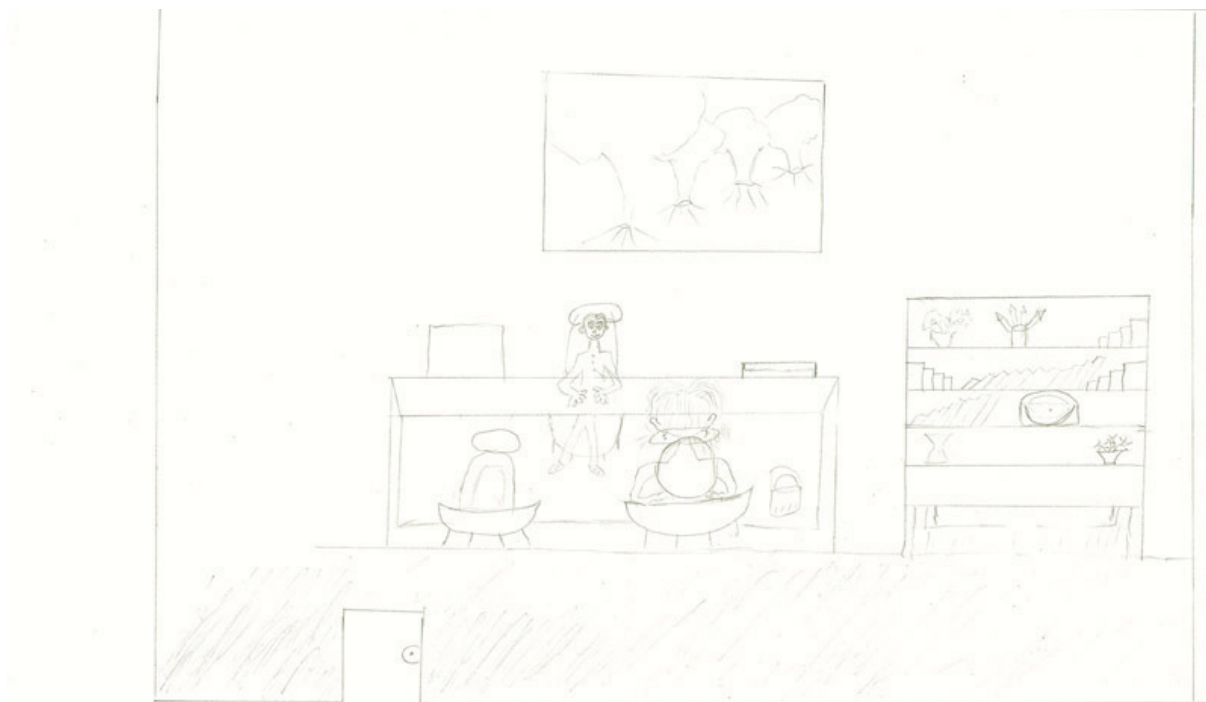
Figura 2. Comunicação gráfica do desenho-estória com tema 2

A esposa está decepcionada com o marido, pois ele não a entende, ela tem dois empregos, o do lar e o secundário. Além de dois filhos. A educação dos filhos, o marido delega para ela, e ele só faz mimar as crianças. Esses filhos ficam sem saber o que é limite e regras, o que dificulta ainda mais. Ela como mãe e cuidadora, sabe o que é melhor para os filhos,