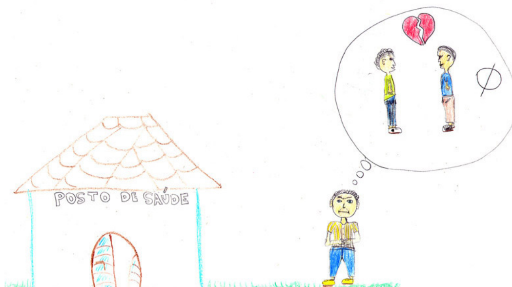
Figura 4. Comunicação gráfica do desenho-estória com tema 4

Os desenhos-estórias que podem ser considerados como emergentes dos campos “Quem sou eu?” e “Rejeição” - vale dizer, aqueles que retratam pessoas cujas vivências escapam à heterossexualidade, norma social vigente - tendem a aparecer sob uma luz negativa, sendo relacionados a vivências angustiadas, sofridas, confusas ou marcadas por dúvidas e incertezas. Tais vivências apresentam-se associadas a sentir-se socialmente diferente ou estranho, expressando-se inclusive como “sentir-se fundamentalmente errado”, talvez até “indigno de existência” no mundo compartilhado.