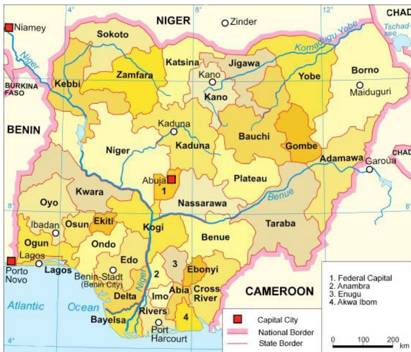
Figura 5. Mapa político de Nigeria

Se alcanzan en Nigeria los actuales 36 estados federales y un distrito federal de la capital Abuja 30 (en el cinturón central, para que sirviese de amalgama de la federación. Ver figura 5).