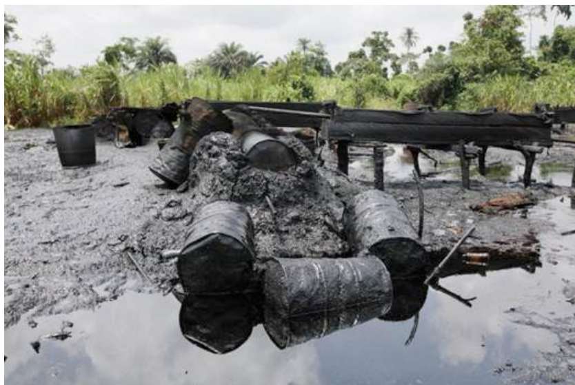
Foto 2. Una refinera ilegal abandonada cerca de Bayelsa (zona ijaw del delta del Níger)

A pesar de ello, en 2013 se contabilizaron 31 ataques de piratas nigerianos de un total de 51 cometidos en el golfo de Guinea, donde se tomaron como rehenes a 49 personas y se secuestró a 36 personas. Dos buques fueron secuestrados frente a las costas de Nigeria, con trece buque asaltados y otros trece sobre los que se disparó. Los piratas utilizaron embarcaciones de alta velocidad escondidas en los estuarios del delta del Níger, aventurándose hasta las aguas de Gabón, Costa de Marfil y Togo, y al menos cinco de los siete secuestros de buques efectuados en el Golfo de Guinea estaban relacionados. 34