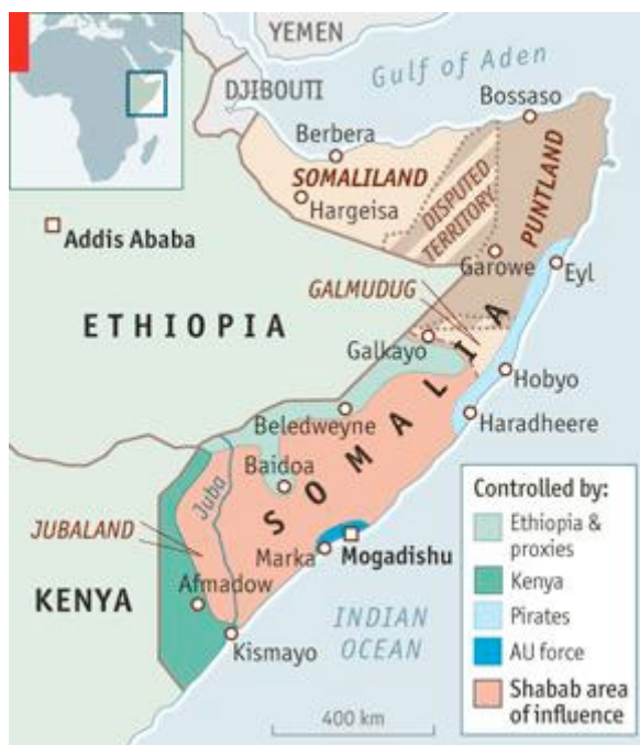
Figura 2. Control de las regiones autónomas de Somalia en 2012

cia británica, frente al golfo de Adén y contigua a Yibuti) y en Puntlandia (en el propio Cuerno de África, zona que estuvo bajo influencia británica e italiana). La región de Galmudug, en el centro del país, también desarrolló una Administración y Policía propias (ver figura 2).