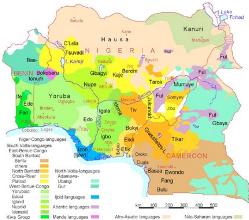
Figura 4. Distribución de idiomas principales en Benín, Nigeria y Camerún

habitantes. Es un país con una gran diversidad étnica (unos 250 grupos), idiomática (más de 500 idiomas hablados) y de religión (musulmanes, católicos, anglicanos, evangélicos, etc. y animistas). El grupo étnico mayoritario en toda la parte norte del país es el hausa fulaní, de cultura árabe, casi todos musulmanes, aunque hay una minoría de cristianos, y utilizan como idioma el hausa (de raíz árabe). Sin embargo, en el noreste (sobre todo en el estado de Borno) está el importante grupo étnico de los kanuri, musulmanes de origen nilo-sahariano, que hablan dicha lengua kanuri, que es también lengua y etnia mayoritaria en el sureste de Níger, el este de Chad y noroeste de Camerún (ver figura 4).