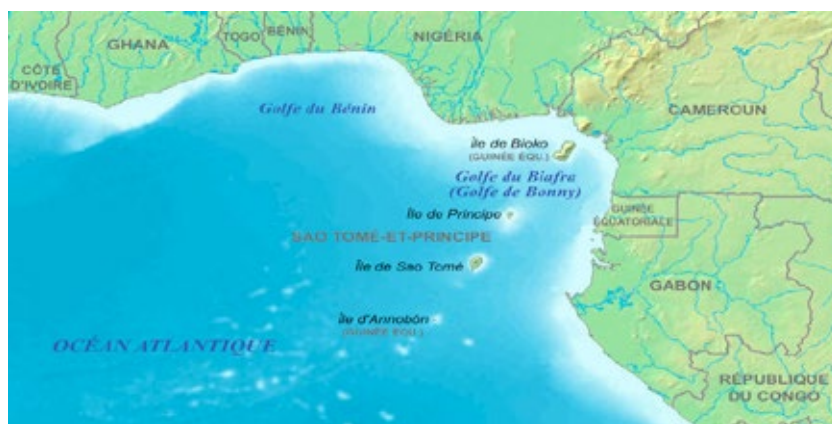
Figura 3. Golfo de Guinea

Geográficamente el golfo de Guinea baña las costas de los siguientes Estados: Liberia, Costa de Marfil, Ghana, Benín, Togo, Nigeria, Camerún, Guinea Ecuatorial, Gabón, y Santo Tomé y Príncipe. Además, el delta del Níger, la mayor desembocadura del planeta, ha creado dos golfos interiores, al noroeste el de Benín y al sueste el de Biafra (ver mapa figura 3).