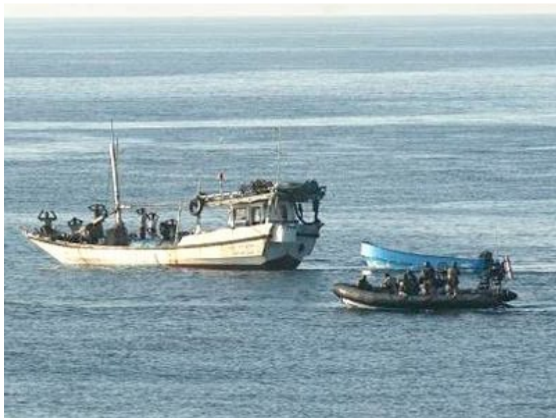
Fotografía 1: Dhow con piratas somalíes y remolcando un esquife.

toda la década, porque la Shura había declarado que la piratería era contraria a la sharí a e incluso las milicias de la Unión de las Cortes Islámicas atacaron y desmantelaron las bases piratas en Hobyo porque interferían el comercio marítimo regional que empleaba los dhow s.