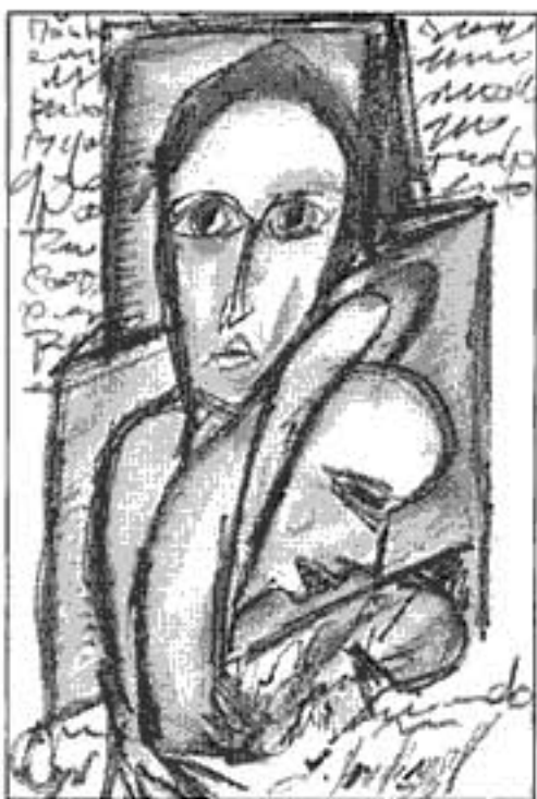
Portada: Jaime Landívar