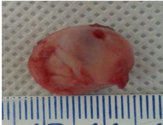
Figura 2. Imagem fotográfica de cabeça de fêmur esquerda de canino SRD apresentando necrose asséptica de cabeça de fêmur bilateral após ostectomia cirúrgica. Observa-se perda do contorno arredondado característico. Cravinhos-SP. 2011.

Para o período pós-operatório, foi prescrito limpeza da ferida cirúrgica com solução fisiológica e instilação de Rifampicina (a cada 8 horas, durante 10 dias) e, aplicação de compressa com gelo durante 20 minutos no local (a cada 6 horas, durante 5 dias), além da administração de Dipirona (27,5 mg/kg/VO, a cada 8 horas, durante 10 dias), Cloridrato de Tramadol (2,0 mg/kg/VO, a cada 12 horas, durante 10 dias), Firocoxib (57 mg/VO, a cada 24 horas, durante 30 dias) e antibioticoterapia preventiva baseada na associação de Metronidazol (125 mg/kg/VO, a cada 8 horas, durante 10 dias) e Espiramicina (750.000 UI/VO, a cada 8 horas, durante 10 dias).