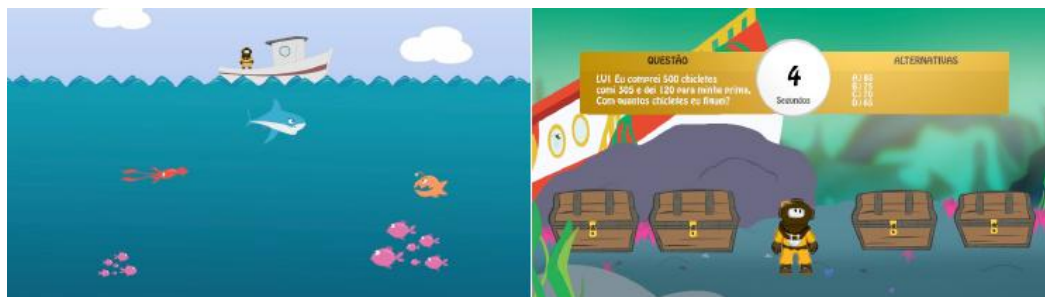
Figura 3 – Tela do jogo Neuro-Navegática

Ao final do gameplay , uma mensagem é exibida, informando o usuário que a próxima fase será iniciada automaticamente. Assim, não é necessária a intervenção por outra interface para que se possam atravessar todos os níveis de uma determinada matéria, em uma determinada série.