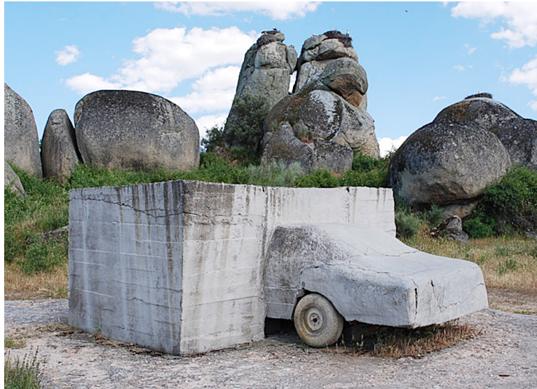
Figura 5. Los Barruecos. Peñas del Tesoro. VOAEX.

La ejemplaridad, singularidad y monumentalidad de sus formaciones graníticas, a las que se unen sus colonias de cigüeñas ( Ciconia ciconia ), el paisaje y los referentes culturales harán que, en el marco del desarrollo autonómico de la protección ambiental, tenga el reconocimiento y declaración como Monumento Natural en 1996 14 . Un proceso de declaración no exento de tensiones alimentadas por intereses políticos