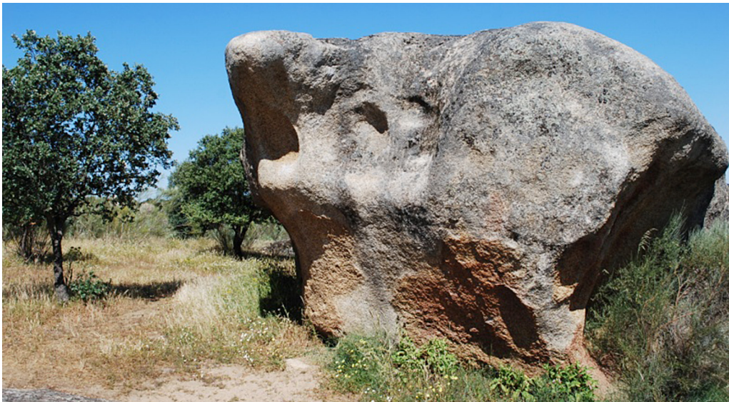
Figura 9. Los Barruecos. «El grito».

A la luz de estas reflexiones parece obligado tratar de aportar, de hacer propuestas que no son sino la manifestación de compromiso con los territorios, con quienes en ellos habitan y, de un modo singularizado, con los paisajes patrimonializados y entornos socio-territoriales de Los Barruecos y Granadilla-Ambroz.