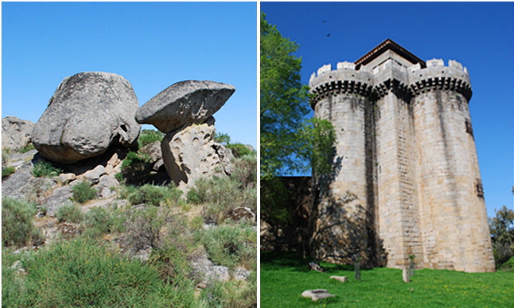
Figura 2. Los Barruecos y Granadilla. Paisaje, patrimonio natural y cultural.

También serán esas aguas las que conformen definitivamente su pasado más inmediato, el de las últimas décadas, su imagen actual y, con toda seguridad, las que alienten su futuro. Y posiblemente ese futuro ahora se antoja más claro y definido en el caso de los Barruecos, más abierto e impreciso en el caso de Granadilla y en ambos casos cargados de incertidumbres y retos para su conservación, gestión, mantenimiento y uso sostenible.