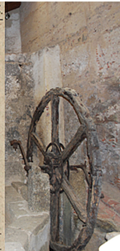
Figura 4. Los Barruecos. Lavadero de lanas.

Fuente: De los datos P. Madoz. De la imagen elaboración propia.