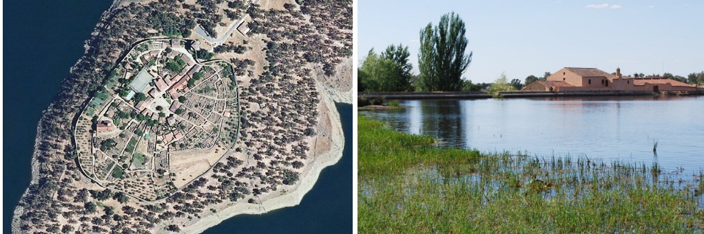
Figura 1. Granadilla y Los Barruecos. Paisajes vinculados al agua.

su modelado. Será el agua la que permita construir y generar en tiempos históricos referentes culturales y económicos que configuren su fisonomía. Será también ese agua la que permita mantener usos tradicionales junto a nuevos referentes y expectativas.