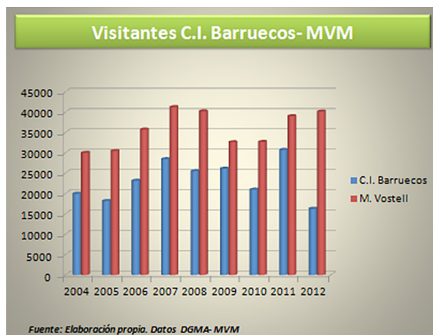
Figura 7. Visitantes del C.I. Barruecos - MVM.

Al número de visitantes del Monumento Natural en sí, pase o no por el CI y/o por el MVM, ha de unirse un colectivo importante de usuarios del mismo, los habitantes de la localidad, para los que los Barruecos es un espacio de identidad y de ocio. De un modo