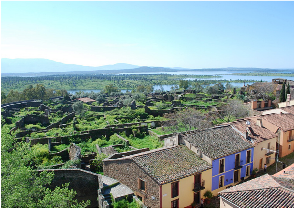
Figura 3. Granadilla. Deconstrucción y educación.

Este espacio, el de Granadilla, ubicado en el medio del Monte de Granadilla que, afectando a las provincias de Salamanca y Cáceres, ocupa una superficie de 6400 has, todas ellas fruto de los procesos expropiatorios que afectaron a los municipios salmantinos de Sotoserrano y Lagunilla y los cacereños de Caminomorisco, Guijo de Granadilla, Mohedas de Granadilla, La Pesga y Zarza de Granadilla. Terrenos gestionados inicialmente por la CHT, desde 2007 han pasado a serlo por el Organismo Autónomo de Parques Nacionales (OAPN) 8 . Es este un espacio que a pesar de una intensa transformación ha sido considerado como hábitat del lince ( Lynx pardina ). En 1988 se declara como Zona de Caza Controlada (ZCC) por la Junta de Extremadura una superficie de 4.944 has. El 29 de febrero de 2011 se inaugura en uno de los bordes del embalse de G. y Galán más próximos a la localidad de Zarza de Granadilla el Centro de recuperación del lince en cautividad, formando parte del «Programa nacional de conservación ex situ » de esta especie gravemente amenazada; en marzo de 2012 nacerán los tres primeros lince en cautividad en este Centro 9 .