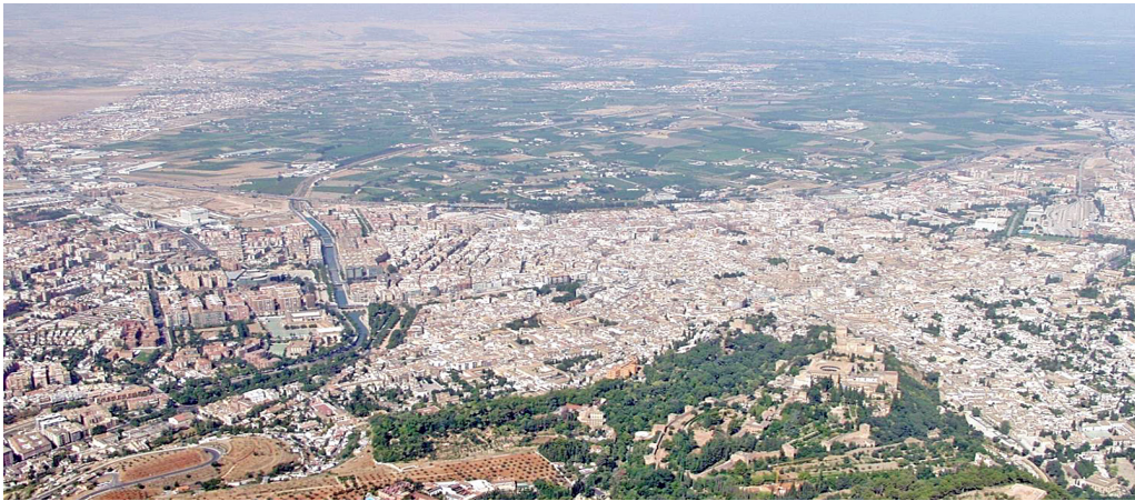
Figura 13. Imagen de la Vega de Granada y su implantación territorial.

Si nos remitimos a la naturaleza patrimonial de los regadíos históricos, extraemos que el elemento esencial del mismo es su funcionalidad agraria, por lo que de aquí se deriva que el ámbito objeto de protección debe ser la globalidad del territorio (y de todos sus elementos constitutivos) en el que se desarrolla la actividad agraria (y derivadas) generada por dicho sistema, es decir la huerta, vega o espacios agrarios similares. Esto permitiría incluir en una misma delimitación todos aquellos sistemas de riego que aparecen interrelacionadas en un espacio agrario determinado, conformando una intencionada y reconocible unidad como asentamiento humano (urbano y territorial). Es el caso de la Vega de Granada.