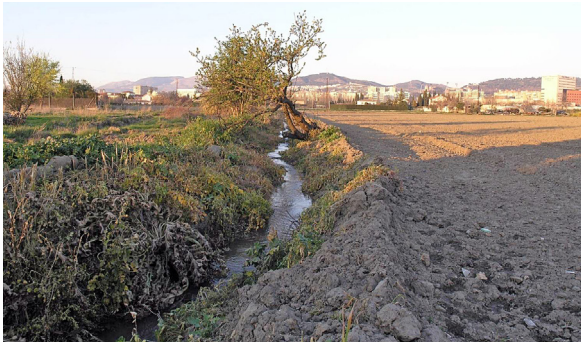
Figura 11. Acequia de tierra en la Vega de Granada (Granada).