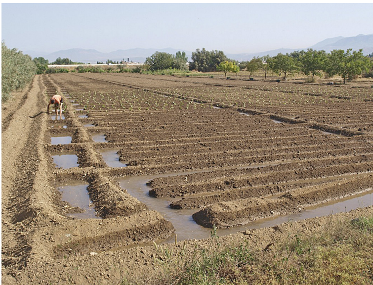
Figura 15. Forma de riego tradicional en la Vega de Granada.

A modo de colofón de todo lo expuesto, quisiéramos reivindicar la relevancia cultural y natural de los sistemas de riego históricos o tradicionales y la necesidad de instaurar mecanismos de protección acordes con su naturaleza material y valorativa, lo que exige especialmente la puesta en marcha de acciones de reconocimiento y divulgación para la ciudadanía dada la dificultad que existe para percibir con claridad sus múltiples valores.