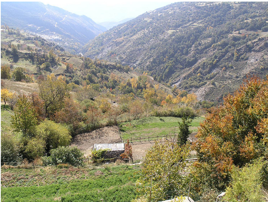
Figura 2. Cultivos aterrazados de montaña. Barranco de Poqueira (Alpujarras, Granada).

La otra visión de los sistemas de riego, la del paisaje agrario, supone considerar a éstos como parte de un sistema de explotación u ocupación territorial, el conformado por la irrigación de un territorio y la construcción de un asentamiento urbano y territorial complementario, el cual, desde la perspectiva patrimonial, conforma un paisaje cultural (fundamentalmente agrario) claramente definido y con carácter. Estos paisajes agrarios del agua son los que en la historiografía adquieren el nombre de regadíos históricos o tradicionales y se suelen identificar a través de los espacios geográficos de huertas, vegas, riberas (SILVA, 2012:s.p.) y, en algunos casos, cultivos aterrazados de montaña.