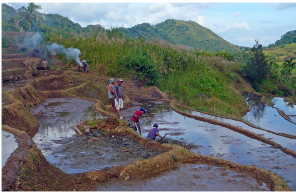
Figura 12. Terrazas de arrozales de las Cordilleras Filipinas y aprendizaje del Hudhud, tradición narrativa milenaria asociada a la cosecha.

gran parte de los trazados están entubados o canalizados con cemento), la valoración de estos sistemas se hace aún más difícil.