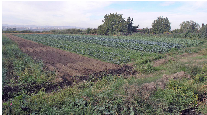
Figura 10. Cultivos en la Vega de Granada.

Dimensión funcional o valor agrícola. Todos estos valores quedan condicionados o supeditados al valor principal que debe justificar su reconocimiento patrimonial, el agrario, que, en este caso, se concreta en su funcionalidad como sistema de riego. Debe observarse, como sucede con el Patrimonio Agrario en su conjunto, no como un valor más sino como un elemento consustancial a su naturaleza patrimonial, por lo que su uso como tal sistema resulta un indicador fundamental para determinar la relevancia patrimonial del mismo. Esto supone incluir también los valores económicos o productivos comunes a todos los bienes agrarios.