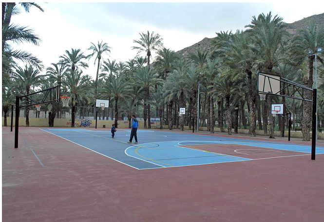
Figura 4. Palmeral de San Antón (Orihuela, Alicante).

Infraestructura deportiva situada sobre el espacio agrícola protegido.