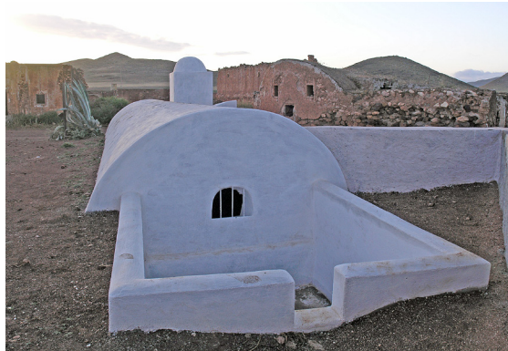
Figura 5. Aljibe-abrevadero. Cortijo del Fraile (Níjar, Almería).

(lingüística, creencias, rituales y actos festivos, conocimientos, gastronomía y cultura culinaria, técnicas artesanales, tesoros vivos, etc.) y patrimonio natural y genético (variedades locales de cultivos, razas autóctonas de animales, semillas, suelos, vegetación y animales silvestres asociados, etc.)» (CASTILLO RUIZ, 2013:32-33). A pesar de esta diversidad de bienes, el Patrimonio Agrario dispone de un carácter holístico e integrador derivado de su elemento constitutivo principal, la actividad agraria.