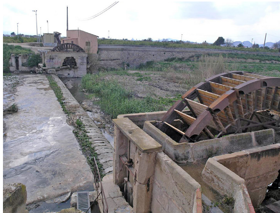
Figura 6. Azud de las Norias (Orihuecla, Alicante).

Valores culturales materiales. Incluiría los valores históricos, técnicos y artísticos relacionados con el sistema hidráulico propiamente dicho (acequias, azudes, presas, partidores, norias, etc.), con los elementos constructivos vinculados a dicho sistema (molinos, albercas, abrevaderos, lavaderos, etc.) y con la arquitectura agraria y asentamientos urbanos relacionados con el mismo.