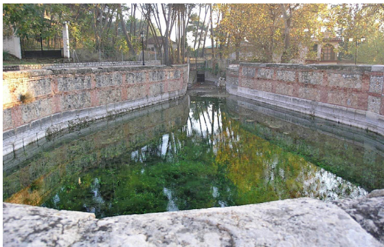
Figura 1. Fuente Grande. Nacimiento de la Acequia de Aynadamar (Alfacer, Granada).

Desde la perspectiva hidráulica, la atención se centra predominantemente en el interés técnico e histórico del sistema de riego: formas y mecanismos de captación del agua, canalización y distribución de ésta por el ámbito irrigado y, en menor medida, la gestión del caudal de agua para las diferentes funciones. Aunque se