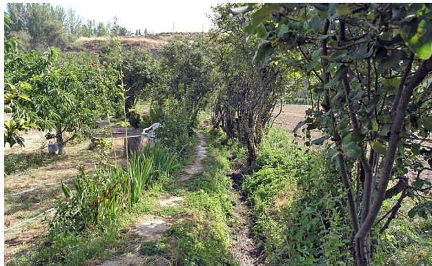
Figura 9. Camino de acequero en un ramal de la Acequia del Albaricoque (Monachil, Granada).