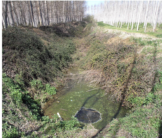
Figura 8. Nacimiento del Jaz de Cotayar (Atarfe, Granada).

Valores ambientales y paisajísticos. Son valores derivados de la interrelación de las dimensiones natural y cultural analizadas anteriormente y que están relacionados con las cualidades que tienen los sistemas hidráulicos para la percepción y disfrute del paisaje. En este sentido destacan, por un lado, el bienestar ambiental que genera el agua (suavización de las temperaturas, rumor, vegetación, etc.) y, por otro lado, las posibilidades de conocimiento y disfrute del paisaje que permiten los recorridos lineales que marcan las acequias. Especialmente relevantes son en este sentido los caminos de los acequeros, esos caminos situados de forma paralela a las acequias y cuya construcción es, en la mayoría de los casos, obra del tiempo; del continuado tránsito nocturno y diurno del acequero y los regantes en su cotidiana tarea agrícola. Unos caminos que además ofrecen una lectura del territorio absolutamente respetuosa