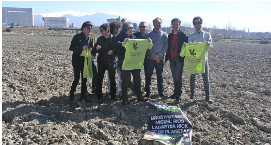
Figura 3. Presentación del concierto Viva la Vega (14 de febrero de 2013) celebrado por Miguel Ríos, Niños Mutantes, Los Planetas, Lagartija Nick y Napoleón Solo en apoyo de la declaración de la Vega de Granada como BIC, Zona Patrimonial.

En este sentido es reseñable, y a pesar del reconocimiento de los valores culturales que todos hacen, el generalizado rechazo a someter a estos espacios al rigor de las figuras de protección previstas en la legislación de Patrimonio Histórico (legislación que consideran como uno más de los ámbitos concertados por la planificación).