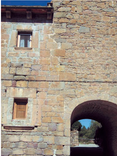
Figura 2. Se observa que la esquina primitiva, algo alterada, pertenece al bloque inferior del edificio (nuestra izquierda), estando el paso abovedado del bloque central adosado a dicho bloque inferior

El bloque central, según algunos estudiosos (11), es más antiguo que el inferior y lo fechan en el año 1642. A mi modo de ver, basándome en detalles arquitectónicos, el paso abovedado del bloque central, que posee arco rebajado y atraviesa el edificio, es más moderno que el bloque inferior de la casa, quizá terminado en el año 1675 (ver figura 2).