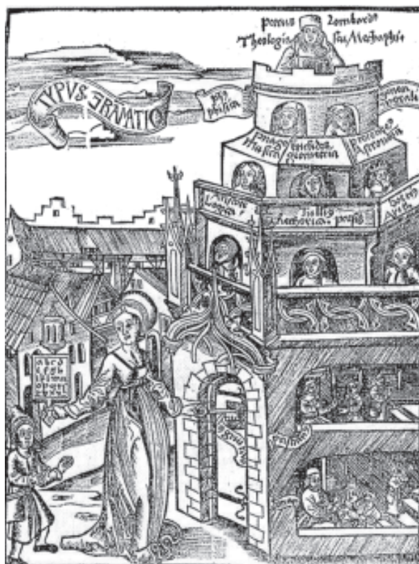
“Typus Grammaticae” en Margarita Philosophica Nova (1503) del humanista Gregor Reisch (1470-1525). Imagen femenina de la gramática guiando a un niño a una torre con las áreas del conocimiento durante la Edad Media y la Edad Moderna: el latín o la gramática en la base (“llave de las otrasciencias”); la Lógica, la Retórica y la Aritmética en el primer piso; luego la Música, la Geometría y la Astronomía; en la cima, los estudios de Metafísica y Teología.

Todos los cuales estatutos y constituciones usando como lleva dicho la plena facultad que para esta le concede el venerable fundador en la última cláusula de su graciossa fundación, hordena y manda se cumplan y guarden, y suplica con profundo rendimiento al Ilmo. y Rmo. señor Arzobispo y señor de Santiago, y a su discreto y docto provisor que para en todo tengan las devidas precauciones y observancia se sirvan autorizarlas con su aprobación mandándolo así por su decreto debajo de grandes penas que para ello se sirvan imponer y en ella conforme las ha hordenado y hordena para el mayor lustre de dicha cáthedra y más utilidad de la enseñanza pública debajo del veneplácito de su Ilma. y lo firma de su nombre y de todo ello yo el notario doy fe.