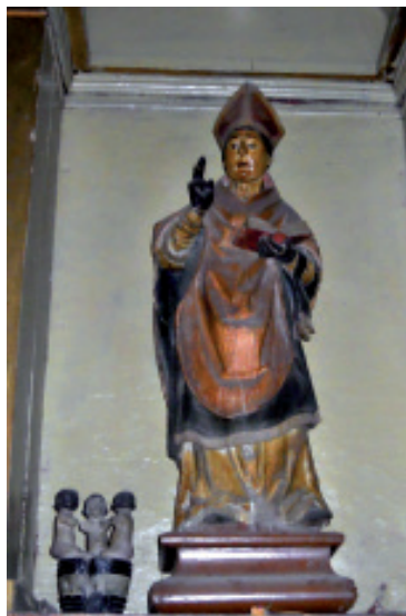
San Nicolás en la iglesia homónima de Villafranca del Bierzo, antiguo colegio de los jesuitas.

A continuación se transcriben las Constituciones de 1712, respetando la ortografía original del documento: