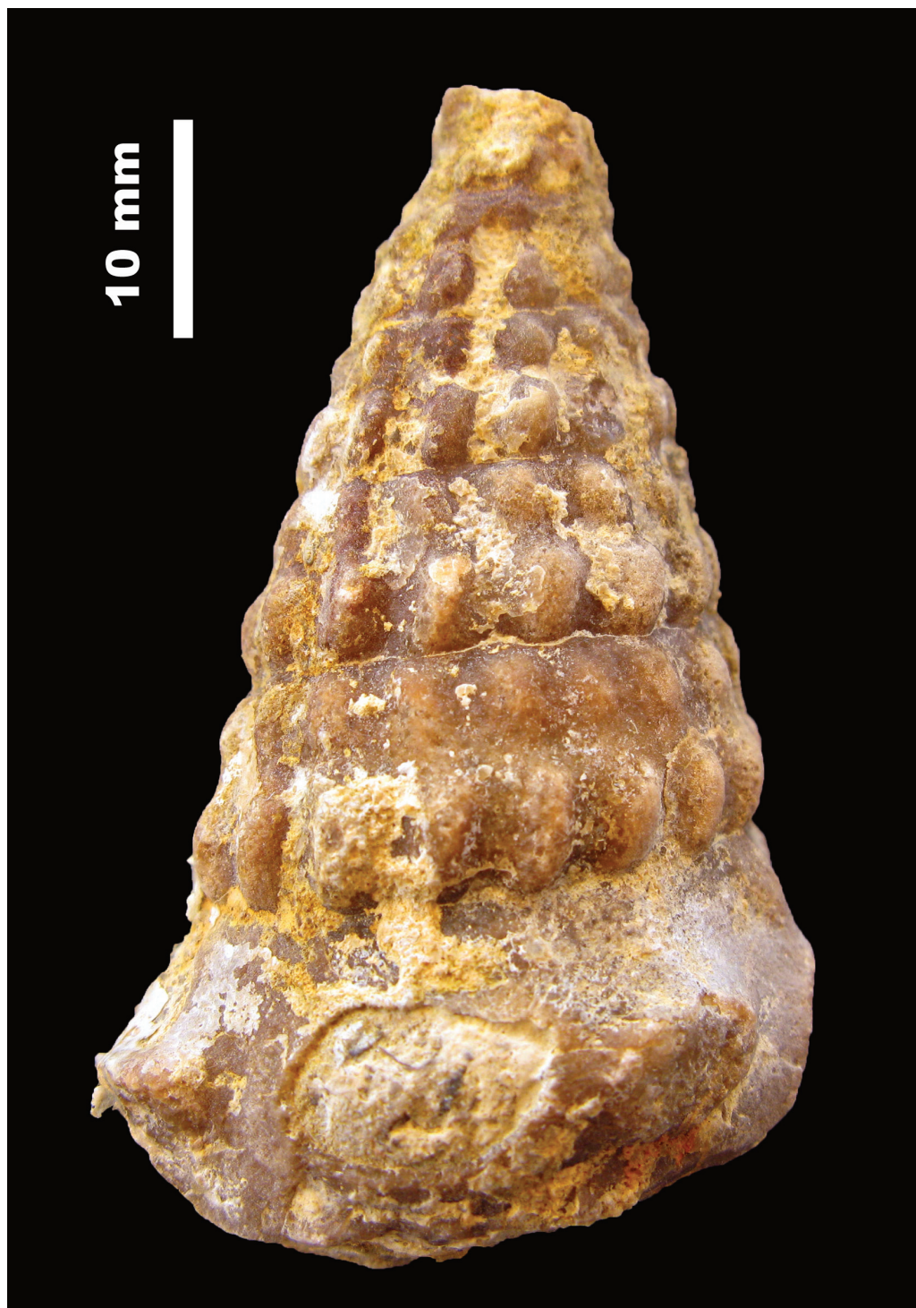
FIGURA 2. Eustoma forneri Calzada, 1996. Vista abapertural. Composició: V. Gual.