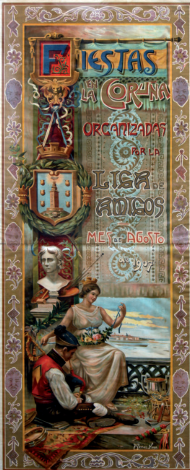
Cartaz das festas da Coruña de 1907 conservado no Museo das Mariñas. Autor: o pintor e profesor da escola de Artes e Oficios da Coruña, José Gómez Naya.