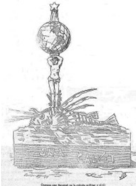
Carroza da Sala Calvet deseñada por Gómez Naya. El Noroeste, 9 de agosto de 1904.

A metade inferior, que é a parte máis pictórica do cartaz, ten como motivos principais en primeiro plano unha muller sentada de fronte nunha balconada á beiramar, suxeitando un cinturón de flores á altura do colo, vestida de túnica branca ao xeito clásico e sandalias, tocada con coroa mural. Trátase, sen dúbida, dunha alegoría da cidade herculina, da que se observa ao fondo unha vista en día soleado. Diante da muller, vemos de perfil un gaiteiro mociño tocando a gaita, o motivo autóctono e enxebre, sentado sobre un colorido pano que sae do marco e monta na orla, creando un curioso efecto. Ao seu carón no chan unha pandeireta e pratiños e á dereita, tamén no chan unha copa (en alusión ao deporte), un bombo (reforzando a alusión á música tradicional) e unhas bandeiriñas (alusivas ás touradas). Baixo estas vai a sinatura do artista: J. Gómez Naya.