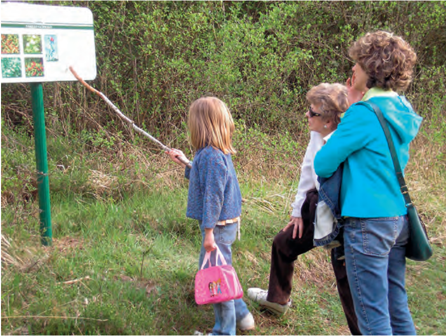
3. Paisaje y educación. Finca de Rivabellosa.

nidad, en su modalidad de Paisaje Cultural, bajo la denominación de Paisaje cultural del vino y el viñedo de La Rioja y La Rioja alavesa nos permite reflexionar sobre las perspectivas educativas del paisaje y su relación con el patrimonio en el ámbito de la Comunidad Autónoma de La Rioja 22 .