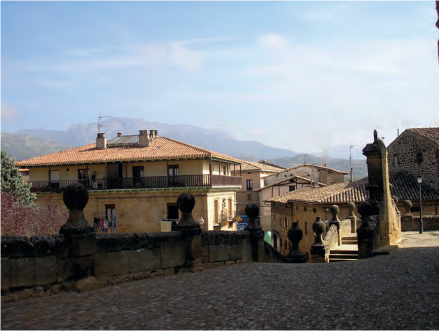
1. Briñas . El paisaje y los núcleos rurales.

refiero al paisaje 4 . Es este un término manido y utilizado con muy diferentes significaciones.