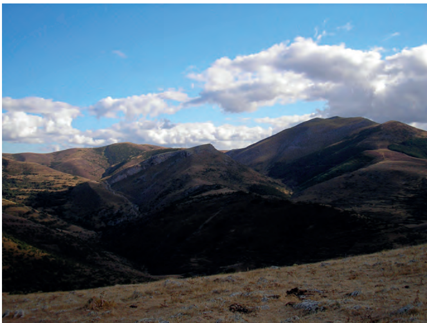
2. Vista desde Peña Hincada. El paisaje de la montaña riojana.

deración algunos documentos europeos claves para entender el potencial educativo del paisaje 7 .