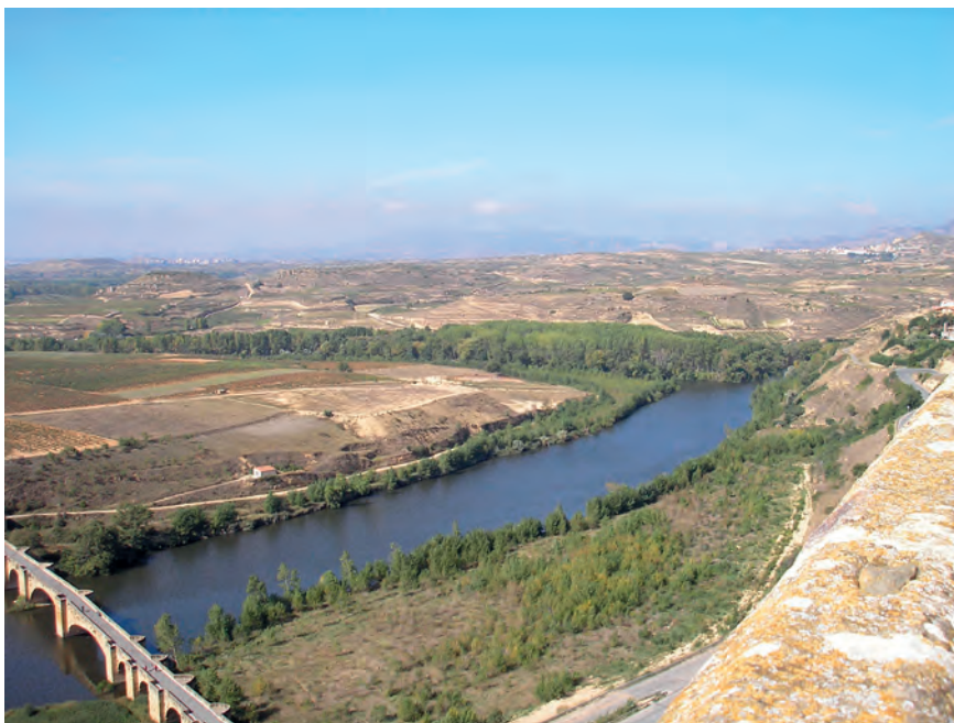
4. La vid y el paisaje del vino. San Vicente de la Sonsierra.

La Comunidad Autónoma de La Rioja cuenta con una considerable variedad paisajística pese a su reducida extensión. La mencionada solicitud como paisaje cultural para el correspondiente a la vid y el vino, supone una oportunidad para establecer algunas reflexiones sobre la situación que presenta en la Rioja este motor educativo tan integrador.