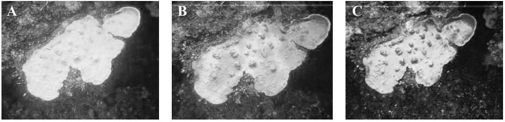
Fig. 3 A. Colonia del género Montastraea tomada el 15 de noviembre de 2005. B. Colonia del género Montastraea tomada el 11 de diciembre de 2005. C. Colonia del género Montastraea tomada el 12 de enero de 2006

Fig. 3 A. Colony of the genus Montastraea , picture taken November 15, 2005. B. Colony of the genus Montastraea , picture taken December 11, 2005. C. Colony of the genus Montastraea , picture taken January 12, 2006