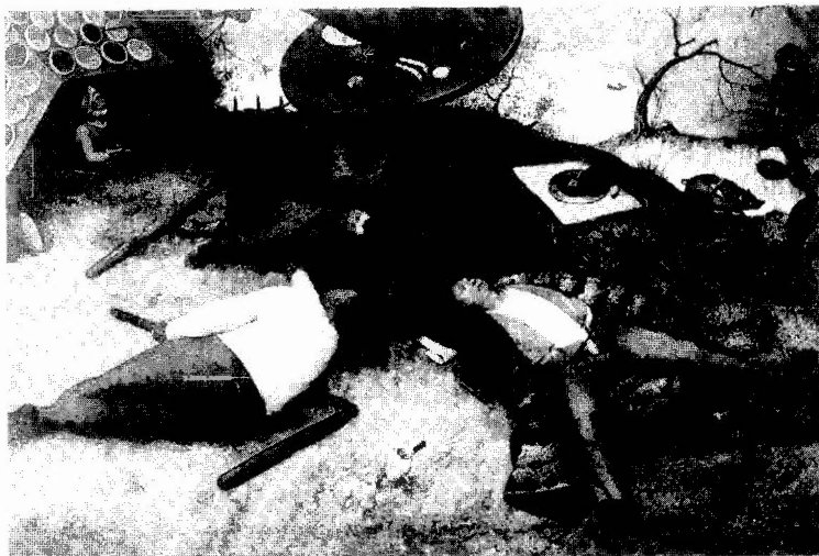
El país de la Cucaña, Pierre Brueghel el Viejo. (1567). Munich, Pinacoteca.

nición para otros. Hasta aquí, hemos sido tan activos como lo éramos antes de que hubiese máquinas; en esto, hemos sido unos necios, pero no hay razón para seguir siendo necios para siempre ψ