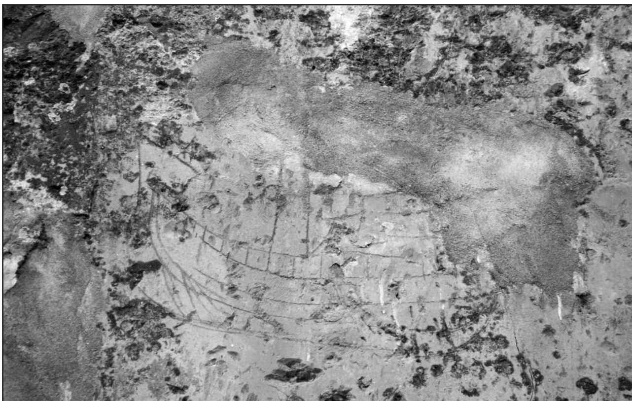
Figura 4. Grafito donde se aprecia con detalle el casco de una embarcación. Imagen F de la fig. 5.

podemos confirmar con fiabilidad su tipología aunque parece ser un jabeque, embarcación muy común en el Mediterráneo (fig. 5, D).