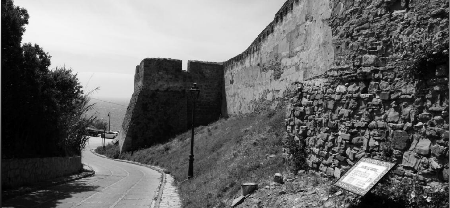
Figura 1. Sector de la muralla donde se encuentra el conjunto de grafitos históricos.