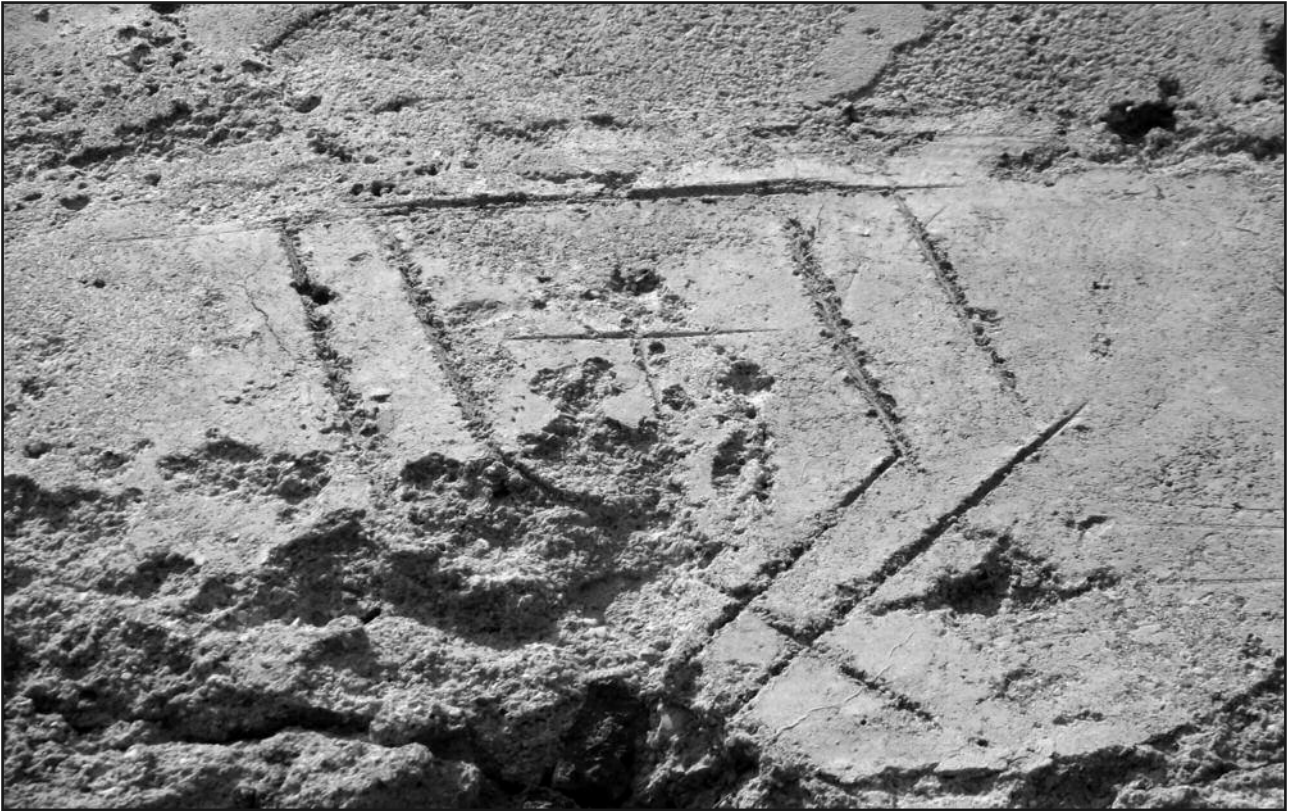
Figura 7. Grafito que corresponde a una de los símbolos o marcas localizados. Imagen K de la fig. 6. Foto autor:

numerosas interrogantes que estos nos presentan.