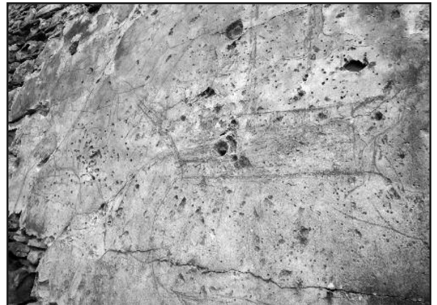
Figura 8. Grafito donde se aprecia una fragata con un bote auxiliar. Imagen N de la fig. 6.

Por último no debemos de olvidar que el conoci-