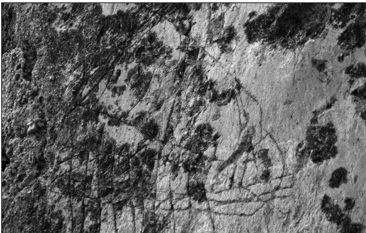
Figura 2. Grafito naval que corresponde a una galera. Imagen A de la fig. 5.

que pasa a ser un elemento a proteger. 4 Es en ese momento cuando al término grafito le añadimos el adjetivo de histórico, pues se convierten en un documento muy útil para el conocimiento de la época de realización de los mismos.