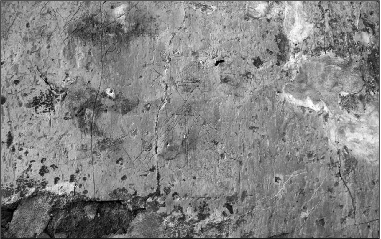
Figura 3. Grafito de embarcación y símbolo. Imagen B de la fig. 5 e Imagen J de la fig 6.

fitos de forma sencilla nos situaremos en la calle María de Molina, frente a la cara este de la torre y siguiendo un orden de izquierda a derecha pasaremos a describir algunos de los dibujos trazados, en concreto los mejor conservados y más identificables aunque debemos mencionar que mientras algunas se conservan en relativamente buen estado como para ver los trazos que conforman cada una de las figuras, en la mayoría de los casos su excesiva esquematización o el deterioro sufrido no permiten establecer su tipología,