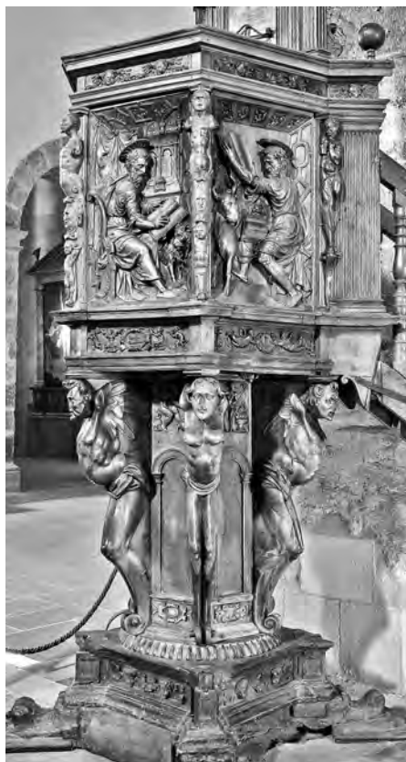
Figura 5. San Millán de la Cogolla. Púlpito de la iglesia, hacia 1555.

Una noticia muy sugerente es la presencia del imaginero Juan de Villarreal en 1551. Vino con el abad de San Juan de Burgos a dar orden de cómo se había de continuar la obra del claustro y ambos aportaron una traza con las dependencias monasteriales anexas al claustro. En Burgos está documentado hasta el año 1551 Juan de Lizarazu, imaginero de Villarreal (Guipúzcoa) que también es conocido en la documentación burgalesa como Juan de Villarreal 31 . Juan de Villarreal talló para el cabildo de la catedral de Burgos una imagen del Salvador en 1532 que se dispuso en el viejo crucero. Entre 1534 y 1537 realizó, para adorno del mismo lugar, representaciones de los cuatro evangelistas y los cuatro doctores de la Iglesia. También para la catedral hizo una figura de San Sebastián y las andas para transportarla, y unas filateras para la capilla de Santiago 32 . En agosto de 1540 Lizarazu contrató 33 con el canónigo Juan Martínez de San Quirce la hechura de un retablo de imaginería para la capilla de San Antón o de la Anun-