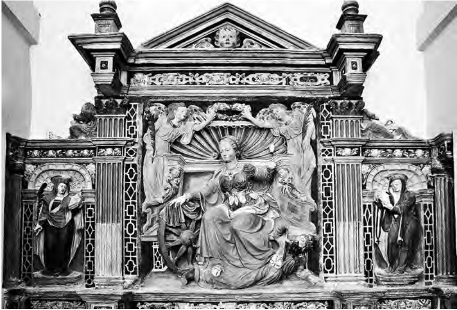
Figura 6. San Millán de la Cogolla. Retablo de Santa Catalina en el claustro alto, h. 1555.

ciación de la catedral burgalesa que muestra figuras esbeltas y movidas. Lamentablemente no se conservan sus últimos encargos, por lo que no se conoce la evolución de su estilo: así un retablo de “media talla” para la iglesia de Santa Clara de Burgos que contrató el 1 de junio de 1551 con Juan de Carboneras, alcalde mayor de las Huelgas. Con anterioridad, el 15 de septiembre de 1547, había convenido hacer en piedra de Hontoria o de Atapuerca la sepultura de Diego de los Ríos e Inés de Miranda que debía colocarse en la iglesia del monasterio de San Francisco de Burgos 34 . Estos documentos evidencian que Juan de Lizarazu o Juan de Villarreal trabajaba la madera y la piedra. Como Solarte declaró que en la portada de la iglesia de San Millán y en las claves de las bóvedas había trabajado el oficial predilecto del monasterio, podemos suponer que fue él, a la espera de otra documentación. Tal vez correspondan a su mano y a su taller el púlpito de madera de la iglesia (Fig. 5), los remates de los contrafuertes del claustro, el grupo de la Asunción de la portada y los tres altares de las esquinas del claustro –seguramente dos de estos altares se corresponden con los conservados en el claustro alto: el de Santa Catalina entre dos monjas santas (Fig. 6) y el de un santo obispo o abad, posiblemente San Benito, entre los