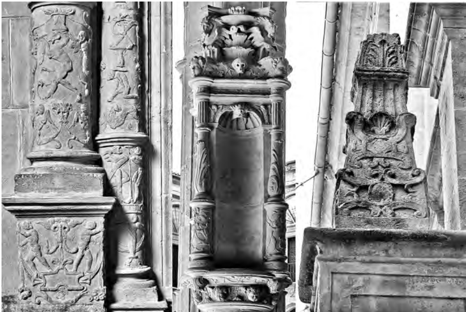
Figura 4. San Millán de la Cogolla. Elementos decorativos, de 1554 a 1559.

la portada dos ángeles tenantes de escudos de la familia López de Haro que se han reutilizado de un enterramiento anterior de finales del siglo XV. Además, encima de los capiteles que flanquean la puerta van dos escudos: uno de la abadía, aunque poco habitual, y otro de la Navarra de los Evreux.