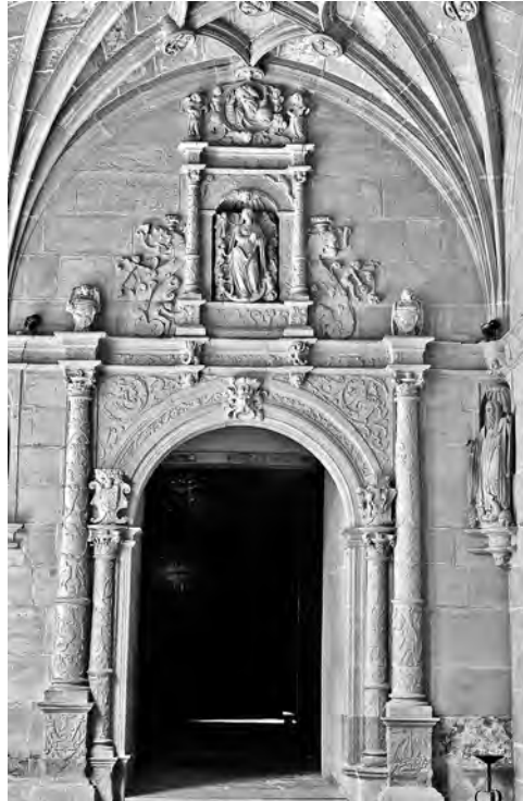
Figura 3. San Millán de la Cogolla. Portada, 1554.

Por su parte, Juan Ochoa de Arranotegui hizo un informe más favorable a Solarte que suponía, aparte de las mejoras pactadas por los tres tasadores, otros 364.712 maravedís a favor del maestro de las obras. Consideró que el contrato indicaba que el muro fuera de responsión a responsión y que había 146 pies largos. Además, refrendó que en lugar de tres arcos para sepulturas había seis y, por tanto, tres de ellos eran de mejora como también lo eran las 196 claves, los 200 combados y los crucesos dispuestos en seis capillas que dan a la iglesia pues en el proyecto no estaban señalados. Sugirió que para resolver el asunto de los maineles y los lazos, como la traza original no aparecía y nada se podía certificar sin ella, Juan de Vallejo realizara bajo juramento otra conforme a la que había hecho para el contrato del claustro. Declaró que, según le habían informado, los escarzanos de las puertas se hicieron conforme al de la entrada de la iglesia y que se siguió el parecer de fray Juan Pardo, abad de San Juan de Burgos, y de Juan de Villarreal, imaginero, que vinieron a dar el segundo plano presentado.