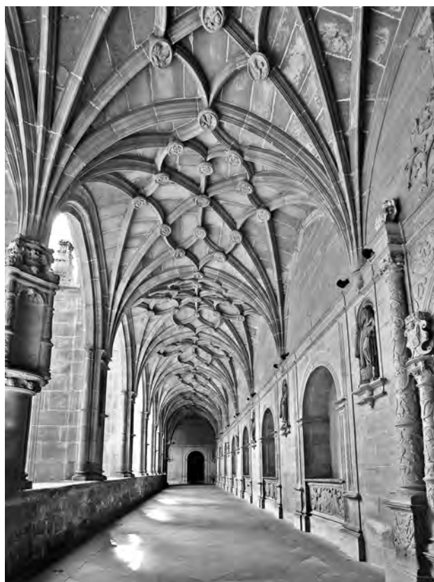
Figura 1. San Millán de la Cogolla. Panda norte del claustro.

puesta a la derecha de la puerta de acceso a la iglesia –se entiende que desde el claustro viejo y es la que hemos dicho que pensaron mantener– hasta otra colocada en la última capilla a los pies de la iglesia. Además se especificaba que a lo largo del espacio delimitado se construyera un muro sobre una zapata que ya existía fuera del vivo o borde de la pared de la iglesia. Para ello, con buena sillaría de piedra de San Asensio, se dispondrían hiladas que ligan la pared nueva con la vieja de modo que cada tres hiladas entrara una en el vivo de la vieja pared la distancia de un pie. En este paño, desarrollado a lo largo del muro de la iglesia, se debían abrir dos o tres arcos para sepulturas de siete pies y medio de ancho y una profundidad de dos pies y medio dentro del vivo de la pared. Estas sepulturas llevarían “gentiles molduras romanas” y pilares con basas y capiteles “con su alquitrabe e friso e cornisa que pasen por el trasdos del arco”.