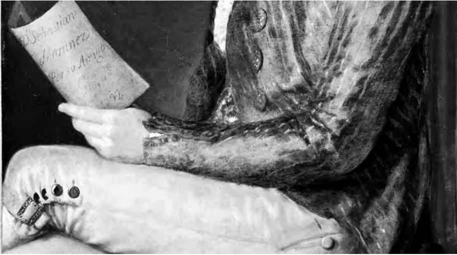
Figura 5. Francisco de Goya. Retrato de Sebastián Martínez. Detalle.

También se cree que esta amistad, reforzada tras la estancia gaditana de 1793 y renovada en varias ocasiones como en la posterior visita a Cádiz de Goya en 1796, motivó la realización de sendos retratos de la hija menor de Martínez, Catalina. Estos cuadros hoy se identifican, no sin dudas, con el retrato de mujer con abanico del Museo del Louvre que estaría realizado tras la muerte de Don Sebastián, y con un retrato de joven con rosa localizado en una colección particular y que se situaría en la misma década del de su padre, con el que coincide, curiosamente, en su vistosa indumentaria 38 .