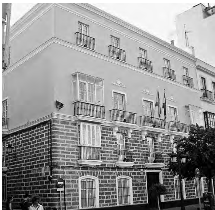
Figura 1. Casa de Sebastián Martínez. Cádiz. Fachada principal.

por el contenido, poco adecuado, de la temática de algunas incluidas en su, cada vez más, influyente colección 16 . Si todo esto es interesante, mucho más relevante me parece el poder intuir que las relaciones de Martínez en los ochenta con el poder y en concreto con la Corte madrileña fueron fluidas.